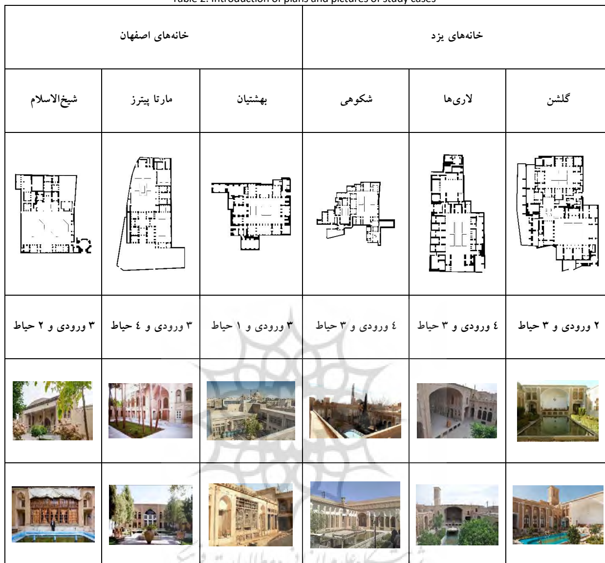
Table 2: Introduction of plans and pictures of study cases