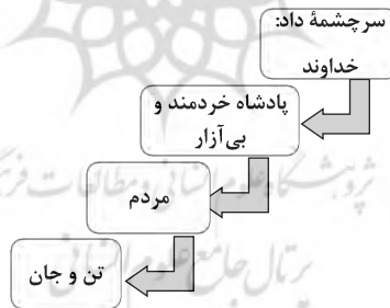
طرح‌وارهٔ اندیشهٔ فردوسی دربارهٔ داد

با استفاده از زبان‌شناسی شناختی، می‌توان اساس اخلاقی سیاست‌های اجتماعی و سیاسی را دریافت. باتوجه به ابیات یادشده و استعاره‌های مفهومی موجود، این ایدئولوژی بنیادین دریافت می‌شود که داد با قدرت همراه است، قدرتی که همراه با مهربانی و رأفت و نظم است. خداوندی که همه چیز در دست او قرار دارد، پادشاهان را می‌آفریند. داد نیز نزد اوست. آن را به کسی می‌دهد که خردمندتر و بی‌آزارتر باشد یا راه دست‌یافتن به آن را به آنها نشان می‌دهد. پادشاهان بر مردم سیطره دارند و داد را در جهان و بین مردم می‌گسترانند و می‌بخشند. هر انسانی نیز که مالک تن خود است، باید داد تن خود را بدهد و در وجود خود داد را برقرار سازد. طرح‌وارهٔ اندیشهٔ فردوسی دربارهٔ داد را می‌توان به شکل زیر نشان داد: