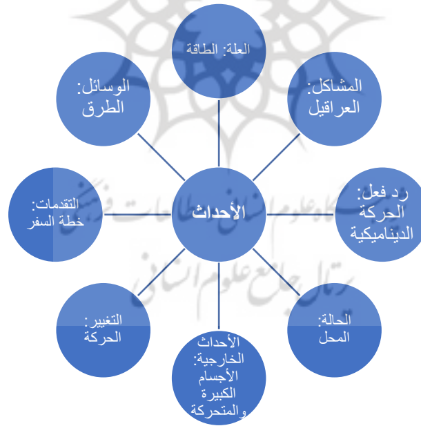
الشكل رقم (٢)