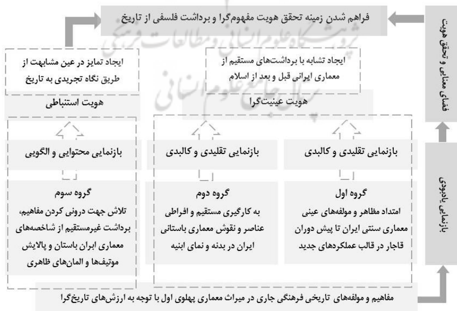
نمودار ۴: مدل تحلیلی جریان‌های تاریخ‌گرایی در میراث معماری عصر پهلوی اول و بازنمود هویتی آن‌ها، مأخذ: نگارندگان.

معماری در سه گروه مورد بررسی و تحلیل قرار گرفت. پس از تحلیل‌های صورت گرفته درباره هرکدام از رویکردهای تاریخی دوره پهلوی اول و تشریح روند هویتی آن‌ها، مطابق نمودار ۴ رابطه مفاهیم هویتی در نسبت با میراث معماری پهلوی اول تبیین می‌گردد. با توجه به این روند چنین استدلال می‌شود که دو جریان معماری گروه اول و گروه دوم، با ایجاد تشابه به‌واسطه برداشت‌های مستقیم از معماری ایرانی قبل و بعد از اسلام، هویتی عینیت‌گرا را ترتیب داده که بیش از همه از عناصر تقلیدی بهره‌بردارند. این نگرش‌ها، روندی تاریخ‌گرا است که بیشتر به مظاهر عینی و کالبدی بنا توجه دارد و المان‌ها و موتیف‌های قابل بهره‌برداری از معماری ایران را بی‌واسطه مورد استفاده قرار می‌دهد. اما ابنیه گروه سوم، به شکل غیرمستقیم، تجریدی و پالایش‌شده، مفاهیم و مشخصه‌های موجود و مستتر در جریان معماری تاریخی ایران را به کار گرفته تا از این طریق شیوه بیان جدیدی از رویکرد بازگشت به گذشته مبتنی بر بازنمایی محتوایی مفاهیم ایجاد گردد. در این رویکرد ضمن توجه به برقراری شباهت با منابع الهامی تاریخی، در نوع به‌کارگیری آن‌ها، تمایزی آشکار ظاهر می‌گردد که بیان هویتی از معماری را در لایه‌ای عمیق‌تری از برداشت که همان هویت استنباطی است، قرار