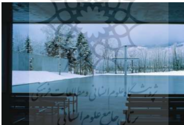
Church on the Water

آندو قصد دارد نور را معنا کند. نور بی‌تاریکی معنایی ندارد. اتفاق تاریک بستر معنایی نور است. در شعر «تا انتها حضور» از کتاب ما هیچ‌ما نگاه ، شاعر شاهد جهان تازه‌ای است که در آن کلمات در حال معنا یافتن است. واژه صبح هنوز معنای نور را بر خود ندارد که یک‌باره شاعر می‌بیند واژه معنای صبح (نور) را می‌یابد. این نور در ظلمات پیشین واژه صبح نمایانده می‌شود. واژه صبح اتاق تاریک آندوست و نور آندو، صبح سپهری است: «داخل واژه صبح / صبح خواهد شد» (سپهری، ۱۳۷۶: ۴۵۷).