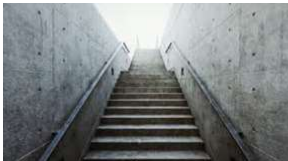
Water Temple Hyogo

«من گره خواهم زد، چشمان را با خورشید» (همان: ۳۳۹).