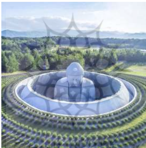
Hill of the Buddha

بودا و سیب با صراحت در کارهای سپهری به جهت عینی و مفهومی حضور دارند: