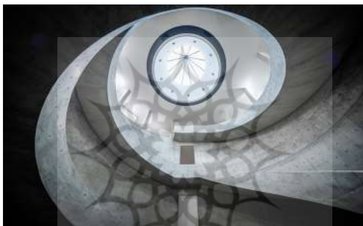
Hyogo Prefectural Museum of Art