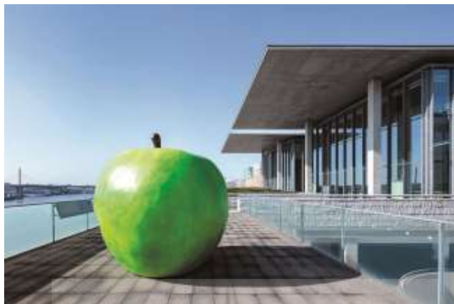
Hyogo Prefectural Museum of Art