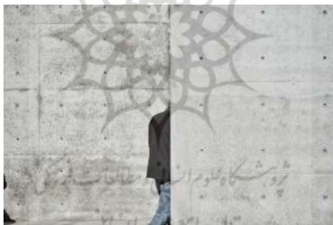
۱۵ Lee Ufan Art Museum

رویکرد هر دو هنرمند، خاصه در کارهای قابل‌اعتنای آن‌ها، نشان از رویکرد هدفمندشان به واقعیت‌های زیستی انسان با مصالح مدرن دارد.