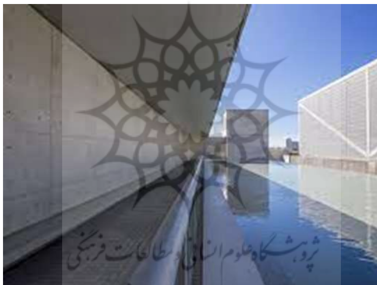
House in Monterrey, Mexico

«من گره خواهم زد، چشمان را با خورشید» (همان: ۳۳۹).