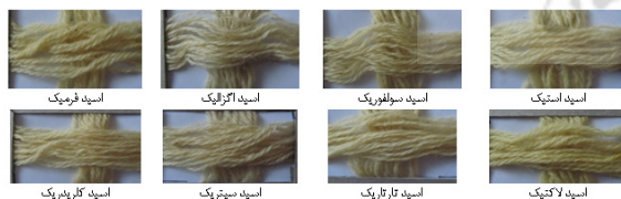
شکل ۳- نمونه‌های پشم رنگ‌شده توسط رنگزای آویشن در حضور اسیدهای مختلف

برای تعیین بهترین روش رنگزای، الیاف پشم به سه روش پیش‌دندان، همزمان و پس‌دندان رنگزای شدند. شکل ۴، نمونه‌های کالای رنگ‌شده با روش‌های مختلف را در حضور اسید استیک و دندان زاج سفید نشان می‌دهد. همان‌طور که