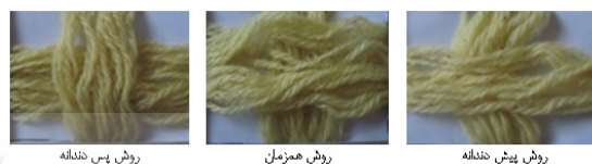
شکل ۴- نمونه‌های پشم رنگ‌شده با روش‌های مختلف رنگ‌رزی

در این شکل مشاهده می‌شود تغییر روش رنگ‌رزی در حضور دندان زاج سفید تأثیر کمی بر فام به‌دست‌آمده داشته است. مشاهده بصری نمونه‌های رنگ‌شده نشان می‌دهد، نمونه رنگ‌شده به روش پس دندان، شدت رنگ بیشتری نسبت به سایر نمونه‌ها دارد. این نتیجه می‌تواند به این دلیل باشد که در مرحله رنگ‌رزی در روش پس‌دندان، یون‌های فلزی که به عنوان دندان استفاده می‌شوند، وجود ندارند؛ در نتیجه در مرحله رنگ‌رزی، کمپلکسی بین رنگ و دندان قبل از نفوذ ایجاد نمی‌شود و امکان نفوذ رنگ‌ها و جذب آن‌ها نسبت به روش‌های دیگر بیشتر می‌شود (اعظمی و دیگران، ۱۳۹۰).