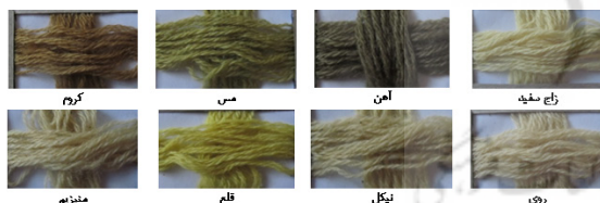
شکل ۲- نمونه‌های پشم رنگ‌شده توسط رنگزای آویشن در حضور دندان‌های مختلف

نتایج بصری (شکل ۳) نشان می‌دهد تغییر نوع اسید، تأثیر کمتری نسبت به تغییر نوع دندان بر فام کالاهای رنگ‌شده داشته است. همان‌طور که در شکل ۳ مشاهده می‌شود، تغییر نوع اسید به مقدار کمی شدت رنگ را تغییر داده است. به طور کلی بررسی نتایج تأثیر نوع اسید، نشان می‌دهد استفاده از اسیدهای مختلف باعث تغییر در مقدار دندان‌های فعال و مقدار جذب رنگ در فرایند رنگزای شده است (Farizadeh et al., 2009: 3799).