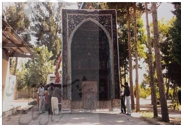
تصویر ۲- نمایی از فیلم: فرش سه بعدی