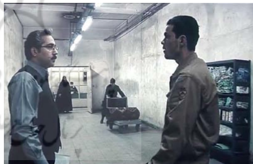
تصویر ۳- نمایی از فیلم: گره‌گشایی