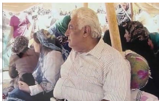
تصویر ۱- نمایی از فیلم: فرش عشایری

چنان‌که مشاهده می‌شود، ابعاد اجتماعی و اقتصادی فقط در ۴ فیلم بازتاب مشخص و عمده‌ای داشته است: «فرش عشایری»، «فرش سه‌بعدی»، «گره‌گشایی» و «کپی برابر اصل نیست». در دو فیلم دیگر، یعنی «فرمایش آقاسیدرضا» و «دست‌آفرینی هدیه به دوست»، در حد بسیار اندک و جزئی به بعد اجتماعی توجهی شده بود که به علت آنکه کلیت این دو فیلم بر این ابعاد متمرکز نبود، از این دو فیلم صرف نظر شد. به این ترتیب، بررسی نهایی محتوای فیلم فرش ایرانی از منظر مباحث جامعه‌شناختی در ۴ فیلم یاد شده انجام شد. در ادامه در مورد هر یک از این ۴ فیلم، ابتدا توصیف کلی فیلم ارائه شده و سپس، شیوه و نوع ظهور و بروز ابعاد و عناصر مرتبط با جامعه‌شناسی هنر، بویژه معطوف به نظریات هینیک و الکساندر ارائه شده است.