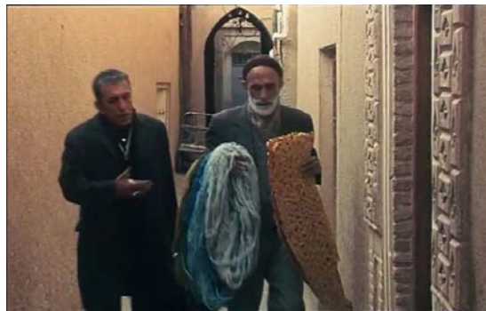
تصویر ۴- نمایی از فیلم: کپی برابر اصل نیست