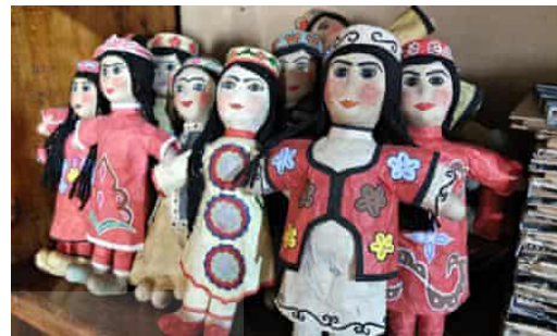
تصویر ۲: کاغذهای دست‌ساز و محصولات تهیه‌شده از کاغذهای دست‌ساز کارگاه ظریف مختاروف (URL2)

همه نمونه‌های اشاره‌شده در مقوله‌های فوق، این مسئله مهم را تبیین می‌کند که می‌توان دانش بومی کاغذسازی