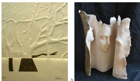
تصویر ۳: نمونه کاغذهای دست‌ساز: الف. دکوراسیون داخلی؛ ب. چاپ دیجیتال؛ ج. استفاده از خمیر کاغذ در مجسمه‌سازی؛ د. کاغذ واترمارک متناسب با چاپ دستی (URL3)