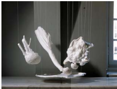
تصویر ۱: نمونه آثار هنرمندان کاغذساز انجمن بین‌المللی کاغذسازان و هنرمندان کاغذ (URL1)