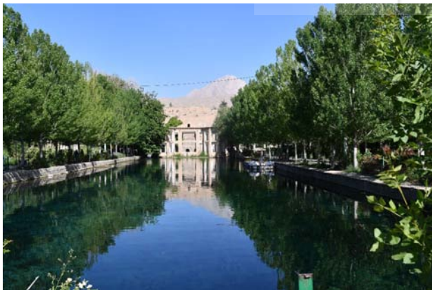
تصویر ۴. طرح کاشت جدید اعمال شده در چشمه‌علی به صورت خطی و منظم و برخلاف طرح کاشت نامنظم قدیمی. عکس: ضیا حسین‌زاده، ۱۴۰۱.

تکایا مکانی با پایگاه معنوی-سنتی و عناصری جدایی‌ناپذیر از کالبد فیزیکی اغلب شهرها و روستاهای ایران هستند (محمود آبادی و بختیاری، ۱۳۸۸). تکایا، فضاهایی عمومی‌اند که به‌عنوان مرکز محله، علاوه بر کارکردهای آیینی خود، محل مکث، استراحت، خرید از حجره‌های اطراف، تجمع و تعامل اهالی و تشکیل شوراهای آبیاری برای تعیین سهم و تقسیم آب در محلات بوده‌اند (آل هاشمی، ۱۳۹۹). تکایا در شهر سمنان نیز به‌طور سنتی نقش‌های آئینی و اجتماعی فراوانی داشته‌اند و معمولاً مرکز محلات و نقاط عطف را در راسته بازار شکل می‌داده‌اند و از این طریق نقش مهمی در منظر شهر ایفا