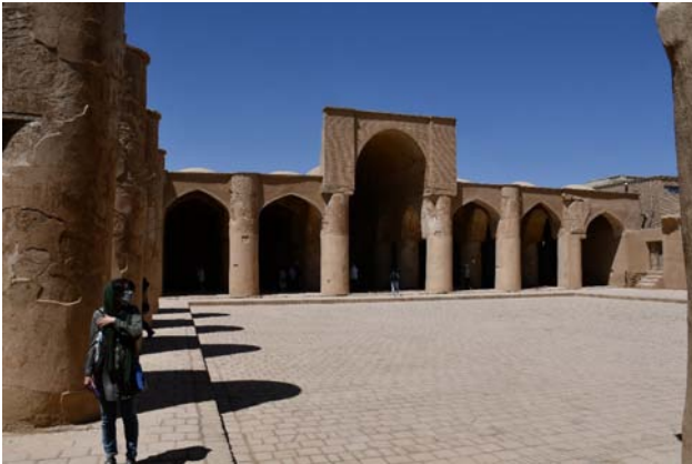
تصویر ۷. عدم جریان زندگی و حیات اجتماعی در مسجد تاریخانه به دلیل نگاه دانه‌ای و کالبدی به منظر شهر. عکس: ضیا حسین‌زاده، ۱۴۰۱.