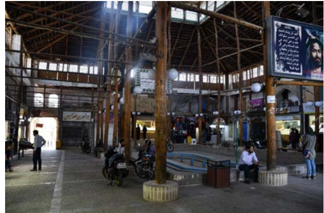
تصویر ۶. متروک ماندن تکیه ناسار در راسته بازار سمنان، خالی شدن این فضا از فعالیت و ازدست‌دادن نقش اجتماعی خود. عکس: ضیا حسین‌زاده، ۱۴۰۱.

جدول ۱. جمع‌بندی بررسی نمونه‌های موردی. مأخذ: نگارندگان.