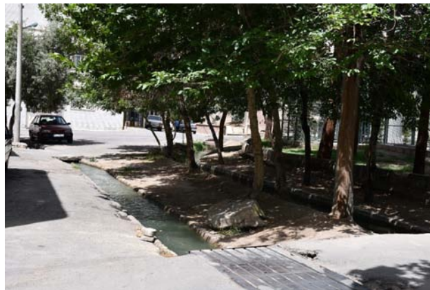
تصویر ۳. از محدود آثار باقی‌مانده از نقش‌آفرینی آب در کوچه‌های شهر سمنان.

شئون زندگی نقش‌آفرین بود، در نگاه مدرن نقشی عملکردی به خود گرفت. در این طرز نگاه با تأمین آب آشامیدنی ساکنین، نیازها برطرف می‌شود. این درحالی است که آب در تاریخ، علاوه بر عملکرد، الگوهای ذهنی مردم ایران را به‌وجود آورده است و شکل‌دهنده آیین و رسوم بوده است. لذا این عنصر که زمانی، علاوه بر تأمین نیازهای عملکردی شهروندان، به شهر حیات می‌بخشید و نزد شهروندان شأن و منزلتی والا داشت، کم‌کم جایگاه ذهنی و معنایی خود و همچنین نقش حیات‌بخش خود در منظر شهر را از دست داد.