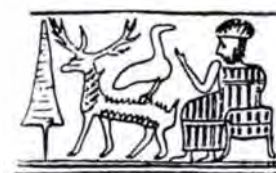
تصویر ۶ الف: مهری از شوش، سبک رایج عیلامی، اوروک (شوش) (Roch 2008, 415)

گیاه، نشان نوشتاری برکت و پرنده سه نماد اصلی هستند که به شکل‌های گوناگون بر سفالینه‌های دوره اسلامی ظاهر شده‌اند. برخی سفالینه‌ها پرنده را درحالی که گیاهی بر منقار دارد مصور کرده‌اند. این تصاویر همانند توصیفات اسطوره‌ای است که پرنده را آورنده گیاه زندگی بخش بیان می‌کنند. اجزای بدن پرنده هم گاهی با نشان گیاهی تزئین شده است. سفال لعاب‌داری از عراق متعلق به قرن ۱۰ میلادی این نوع تصویرگری را نشان می‌دهد (تصویر ۷). پرنده دُمی شبیه طاووس دارد. طاووس پرنده‌ای خورشیدی است (هال ۱۳۸۰، ۶۶). اما نشان قابل توجه دیگر، دایره‌ای است که در مرکز آن نقطه‌ای قرار دارد و نماد خورشید در خطوط کهن است (قادر ۱۳۸۸، ۵) و یا دایره‌ای که در مرکزش دایره دیگری قرار گرفته و در هزاره سوم پیش از میلاد نماد چاه و آب است (واکر ۱۳۸۶، ۱۳). در اینجا دم پرنده مزین به دو دایره است که همین نشان دورتادور لبه داخلی ظرف را تزئین کرده است. بر مبنای خوانش خطوط تصویری، اگر این نشان تعبیر به آب شود، همنشینی آب، گیاه، پرنده و برکت، تداعی‌کننده وجهی از باروری و زندگی است و اگر تعبیر به خورشید شود، همنشینی نماد خورشید مظهر گرمابخشی به زمین و رشدیابندگی گیاه در کنار نماد پرنده، گیاه و کلمه نوشتاری برکت مصور است.