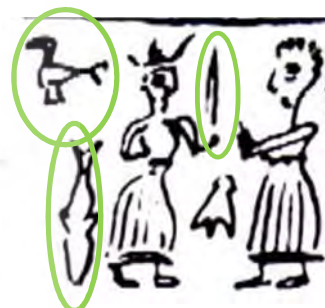
تصویر ۱۲: مهر عیلامی، لری سرخ دم. اوایل عیلام میانه، دوره برنز (Roach 2008, 479)