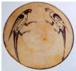
تصویر ۸: کاسه منقوش گلابه‌ای، قرن دهم میلادی (خلیلی و گروه ۱۳۸۴، ۸۲)

پرنده یکی از اصلی‌ترین نقوش تزئینی مهرهای عیلامی و آثار اسلامی است (تصویر ۱۴). مهری از شوش پرنده‌ای را بر پشت گوزن در کنار نمادی درختی نشان می‌دهد. در بسیاری از مهرها نماد پرنده در مقابل خدایان و مهران ترسیم شده است (تصویر ۶ الف). در مجموعه آثار نیشابور پرنده به شکل‌های مختلفی ظاهر شده است. (تصویر ۶ ب، کاسه سفالین نیشابور را نشان می‌دهد که در مرکز و حاشیه آن پرنده‌ای بال‌دار دیده می‌شود. پرنده مرکزی با بال‌های گشوده حالت پرواز را تداعی می‌کند. همانند سفال‌های سامانی بال‌های پرنده به شکل نخلک است (خلیلی و گروه ۱۳۸۴، ۹۴) در حاشیه ظرف پرنده‌هایی مصور شده‌اند که دُمی شبیه گیاه پیچان دارند. وجود این نشانه گیاهی بر بدن پرنده را می‌توان تصویرگری رمزگونه بیان کرد (Hillenbrand 2005, 113) ارتباط گیاه و پرنده در اسطوره‌های ایرانی به‌زیبایی به تصویر کشیده شده است که در تفسیر پرنده نمادین این ظرف می‌تواند راهگشا باشد. پرنده نماد خوش اقبالی است (کوپر ۱۳۸۶، ۷۲) در وداها پرنده‌ای به جست‌وجوی نوشابه مقدس سومه، بر روی کوهی دست‌نیافتنی رفت و آن را به انسان هدیه کرد (قلی‌زاده ۱۳۸۸، ۴۵۴). در زادسپرم، سیمرغ گستراننده تخم درخت زندگی و مایه رشد حیات گیاهی است (تفضلی ۱۳۵۴، ۳۰۱). گیاه نماد رشد است و پرنده نماد وحدت‌بخش زمین و آسمان (Baring 1991, 59). این نشانه‌های تصویری خیر، مکمل عبارت نوشتاری بسیاری از سفالینه‌های دوره اسلامی است.