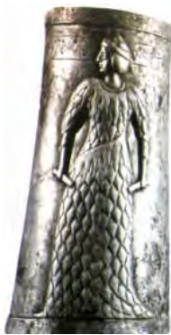
تصویر ۱: جام سیمین از عیلام؛

«یاری کن الهه، یاری کن، من کوری ناهی تی هستم. اهداکننده آشامیدنی نذری، برای پروردگار بخشنده پاداش نیک، خیر و برکت؛ ای الهه مقدس، نازل شو. لطف و مرحمت الهیت پیوسته باید به برپادارنده معبد ارزانی شود. یاری کن تو این جام را که از سوی یک بنده برگزیده مقرب اهدا شده، برای وی روزبه‌روز مقدس دار.» (صراف ۱۳۸۷، ۴۹) (تصویر ۱). در این جام علاوه بر اینکه تصویر ایزدبانوی پیروزی عیلامی به‌عنوان یک نشان تصویری از ایزد برکت و پیروزی بخش آمده است، کتیبه نوشتاری دعای برکت را هم نشان می‌دهد.