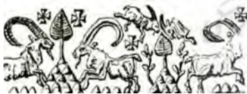
تصویر ۵ الف: بز کوهی بر نقش برجسته عیلامی (پوپ و آکرمن ۱۳۸۷، ۳۶۷)

این ظرف به شکل دایره است و حاشیه آن با دایره‌های تکرارشونده تزئین شده است (تصویر ۴). این شیوه تزئین ویژگی خاص تصویرگری ساسانی است (گیرشمن ۱۳۷۰، ۲۷۷). «دایره نمادی جهانی است. تمامیت، کلیت، تقارن، کمال اولیه، لایتناهی، بی‌زمانی از مفاهیم آن است» (کوپر ۱۳۸۶، ۱۱۴۰). بنابراین نشان‌های این سفال مفهومی رمزی را تداعی می‌کنند. همنشینی نمادها قابل تفسیرند. برکت، سلامت (به صورت نوشتار)، زمین زیر کشت (مربع تقسیم به چهار شده در مرکز)، دایره نماد جهان لایتناهی (قاب دایره‌ای ظرف و دوایر تزئینی حاشیه). کلیت نمادها، دعای بی‌پایان آرزوی سلامت و برکت را بیان می‌کند. همان گونه که تطبیق کتیبه‌نگاری‌های عیلامی با مفهوم برکت و سفالینه‌های اسلامی نشان می‌دهد، سفالینه‌ها ظروف غذا هستند و در دوره اسلامی برکت کردن غذا برای ایرانیان اهمیت داشته است. نوشته‌ها به خط کوفی مؤید این مطلب است اما مهرها زمینه‌های ثبت باورها، عقاید و پیام‌های رمزی عیلام‌اند و ارتباط میان مفهوم برکت و شکل کتیبه وجود ندارد؛ این نتیجه در سایر تطبیق‌ها نیز قابل بررسی است.