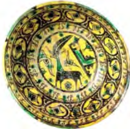
تصویر ۵ ب: کاسه‌ای از نیشابور، قرن دهم میلادی (خلیلی و گروه ۱۳۸۴، ۶۸)

بر مهرهای عیلامی تصاویر زیادی از نماد بز دیده می‌شود. عموماً بز به خدایان و بزرگان تقدیم می‌شود. تصویر ۵ الف، بز را دو سوی درخت مرکزی بر رأس کوه نشان می‌دهد. این ترکیب سه‌تایی با عناصری مثل نماد چلیپا بازنمایی شده است. برخی آن را بازنمایی بز همراه با ماه‌درخت مقدس بیان کرده‌اند (پوپ ۱۳۸۷، ۳۱۲۴). این نشان در آثار اسلامی نیز به کار رفته است. بر کاسه نیشابور، قرن دهم میلادی بز کوهی نشان تصویری نمادین است که در مرکز کاسه قرار گرفته و نوشته‌ها به خط کوفی کلمه «برکت