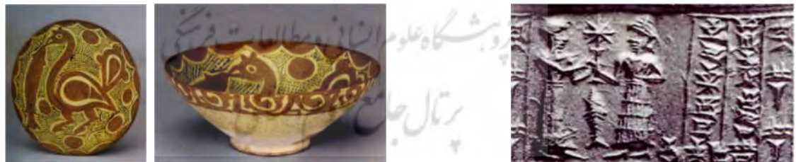
تصویر ۱۰ الف: مهری از شوش، معبد این شوشیناک (Roach 2008, 421) تصویر ۱۰ ب: ظرف سفالین، شرق ایران، قرن دهم میلادی (Pancaroglu 2007, 73) سبک بابلی کهن، ماهی را در لحظه تقدیم نشان می‌دهد.

نماد برکت و باروری علاوه بر پرنده با نماد ماهی نیز بر آثار عیلامی و سفالینه‌های دوره اسلامی تصویر شده است. در مهری از شوش کشف شده از معبد این شوشیناک صحنه تقدیم آیینی انجام می‌شود. در این صحنه، ماهی حاضر است. به نظر می‌رسد در این مهر ماهی نماد برکت است (تصویر ۱۰ الف). مهر دارای کتیبه‌ای است. هابوبو، پسر مامنوم، شائین، شو، خدمتگزار نینسیانا (Roch 2008, 421).