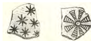
تصویر ۱۴ الف: سفالینه‌هایی از شوش (Demorgan 1905, 113)

نشان انتزاعی خورشیدی، در مرکز سفالینه‌ای از ایران متعلق به اوایل قرن سیزدهم قمری ظاهر شده است (تصویر ۱۴ ب). این ظرف با رنگ آبی و اگر درخشان زیر لعاب مات سفید نقاشی شده است. نشان مرکزی آن در خطوط کهن نماد خورشید، آسمان (قادر ۱۳۸۸، ۶) و