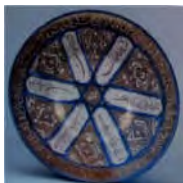
تصویر ۱۴ ب: سفالینه‌ای از مرکز ایران، قرن ۱۲م (Pancaroglu 2007, 116)

نشان ستاره‌ای در کتیبه‌های مکشوفه از اوروک III موجود است و ایزد یا ایزدبانو ترجمه شده است (Nissen 1994, 21). نمادهای خورشیدی نیز به شکل ستاره مصور شده‌اند. در اندیشه ایرانیان خورشید جاودانه است و از فرّ و فروغش برکت و حاصلخیزی بر جهان ارزانی می‌شود (قلی‌زاده ۱۳۸۸، ۱۹۶). در سفالینه‌های شوش این نشان به شکل‌های مختلفی به کار رفته است (تصویر ۱۴ الف).