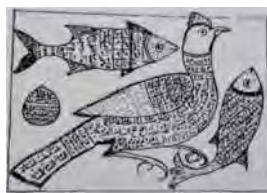
تصویر ۱۱: نماد مرغ و ماهی از یک طلسم هندی (تناولی ۱۳۸۷، ۹۰)

در آثار اسلامی، طلسم مرغ و ماهی، مرتبط با برکت است و کاربرد آن حتی در اشعار عامیانه نیز مشخص است. هرکه در خواب ببیند مرغ و ماهی / یا به دولت می‌رسد یا پادشاهی (تصویر ۱۱) (تناولی ۱۳۸۷، ۹۰).