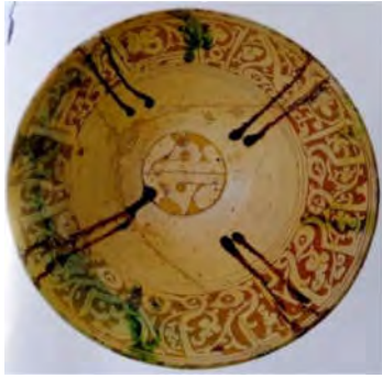
تصویر ۳: کاسه ایران، ناحیه گروس، قرن یازدهم و دوازدهم میلادی (خلیلی و گروه ۱۳۸۴، ۱۱۰)

مفهوم برکت بر ظروفی باشد که در زندگی روزمره پرکار بودند. بنابراین نقوش گیاهی مقوله رشد و زندگی را به صورت نمادین بیان می‌کنند. برای مثال سفالینه‌ای از ایران، ناحیه گروس که متعلق به قرن یازدهم و دوازدهم میلادی است، مزین به نشانه نوشتاری «برکه و یمن و عز و غرور بها و بقا لصا [حبه]» است که در بستری از نقوش گیاهی نگاشته شده است. موتیف مرکزی ظرف هم احتمالاً کلمه حمد است (تصویر ۳) (خلیلی و گروه ۱۳۸۴، ۱۱۰). در فرهنگ شیعی، حمد و ستایش پروردگار کلید برکت بخشی است و جلوه آن را می‌توان در ضرب‌المثل‌ها و اشعار فارسی نیز جست‌وجو کرد. «شکر نعمت نعمت افزون کند / کفر نعمت از کفت بیرون کند» ضرب‌المثلی است که گفته می‌شود از این شعر مولانا گرفته شده است: شکر قدرت قدرتت افزون کند / جبر نعمت از کفت بیرون کند (مولوی ۱۳۷۳: دفتر اول، بخش ۴۷، ۱۱).