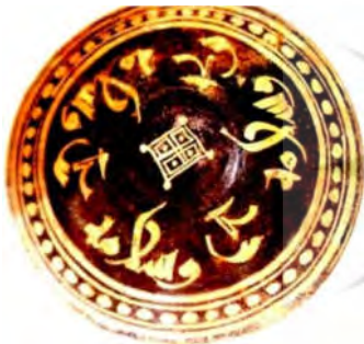
تصویر ۴: کاسه نیشابور، قرن دهم میلادی با کتیبه برکه و سلامه (خلیلی و گروه ۱۳۸۴، ۸۷)

شده که به حالت شعاع‌گونه از لبه کاسه به سمت مرکز نوشته شده و عبارت والسلامه به صورت متحدالمرکز قرار گرفته است. به همین علت حالت چرخشی خاصی ایجاد کرده است (تصویر ۴) (خلیلی ۱۳۸۴، ۸۷). در مرکز ظرف نشان مربعی قرار دارد که به چهار مربع کوچک‌تر تقسیم شده و در مرکز آن‌ها نقطه قرار دارد که «مربعی که به چهار قسمت تقسیم می‌شود، احتمالاً نماد زمین (زمین در چهار جهت اصلی، زمین کامل) زیر کشت است» (Golan 2003, 218). پیشینه این نشان را می‌توان در هنر کهن ایران جست‌وجو کرد. در خطوط تصویری عیلامی، مربعی که به چهار قسمت تقسیم شده دیده می‌شود (Brice 1962, 37). و در خط سومری این نشان به معنی بز ماده یا گوسفند است (Woods 2015, 38) که در این صورت نیز با معنای باروری مرتبط است. در هنرهای کهن بز نماد باروری است (کوپر ۱۳۸۶، ۵۷).