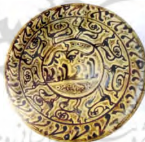
تصویر ۶ ب: سفالینه نیشابور، قرن دهم و یازدهم میلادی (خلیلی و گروه ۱۳۸۴، ۹۳)