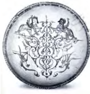
تصویر ۱۶: کاسه نقاشی‌شده روی لعاب، سده هفتم پیش از میلاد؛ مجموعه سی. ال. دیوید (پوپ و آکرمن ۱۳۸۷، لوح ۶۵۸)