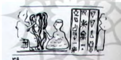
تصویر ۱۳ الف: مهری از شوش (آمیة ۱۳۸۹، ۹۸)