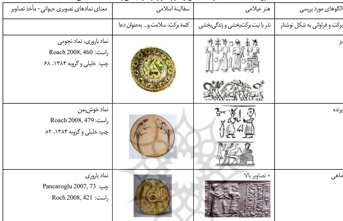
جدول ۱: مقایسه نمادهای برکت به شکل نوشتار و تصویر در هنر عیلامی و سفالینه‌های اسلامی

و الدولة و البقالک العز الدائم و الاقبال الزائد و النصر الغالب و العمر السالم و الجد الصاعد و السعادة و القدرة و البركة و القدر و البقا لصاحبه» (خلیلی و گروه ۱۳۸۴، ۱۸۸). بنا بر متون حاضر و با استناد بر نوشته‌های موجود می‌توان گفت همان طور که برکت و زندگی یکی از وجوه مهم متون مکتوب و اسناد تصویری هنر کهن ایران است، در سفالینه‌های اسلامی این مضمون به صورت خط‌نگاره‌های نوشتاری در کنار نشانه‌های تصویری نمادین بیان شده و از مضامین اصلی سفالینه‌های اسلامی است.