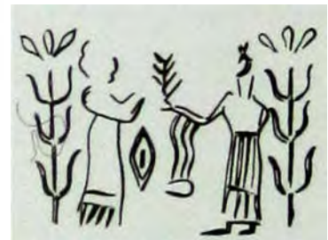
تصویر ۱۵ الف: مهری از شوش هزاره سوم پیش از میلاد (Amiei 1979, 34)

مجموعه سفالینه‌های مورد بررسی عناصر تصویری و نوشتاری تحلیل شد که با مفهوم زندگی و حیات و برکت ارتباط مستقیمی داشته‌اند. اگر این موضوع با مفاهیم اکثر کتیبه‌های سفالینه‌های دوره اسلامی مقایسه شود، هماهنگی مفهوم تصویر و نوشتار در این کتیبه‌ها روشن‌تر خواهد شد. برای مثال می‌توان به کتیبه موجود بر ظرفی سفالینه‌ای متعلق به قرن دوازدهم یا سیزدهم میلادی اشاره کرد که مجموعه‌ای از دعای خیر برای زندگی است. «العز و الإقبال الزائد و التصر و النصر الغالب و الدولة و السعادة (د) و الدولة و السعادة و الدولة و الكرامة و النصر»