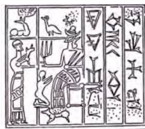
تصویر ۲: مهری از چغازنبیل، تپه

(خواستارم)» (Roch 2008, 508) (تصویر ۲). بر روی این مهر و بسیاری از مهرهای عیلامی که ایزدی یا ایزدبانو را نشسته بر تخت نشان می‌دهد، صحنه تقدیم فدیة یا نذر به چشم می‌خورد. در صحنه نیایش علاوه بر حضور پادشاه به‌عنوان واسطه خیر، نشان‌های حیوان شاخ‌دار، پرنده، ستاره چند پر یا شمشه، مثلث با رأس رو به پایین و نیز شکلی ماهی‌مانند دیده می‌شود. عبارات «برکت و زندگی دهد» در این دو کتیبه، جالب توجه و گواه بر این نکته است که نذر و نیایش با درخواست زندگی و برکت همراه است و این نذر برای ایزدان و الهگان که