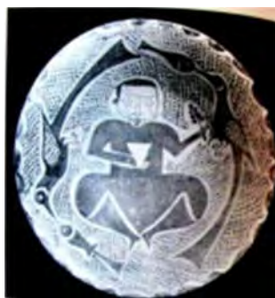
تصویر ۱۳ ب: سفالینه دوره عباسی، قرن نهم تا دهم میلادی (Hillenbrand 2005, 104)

تصاویر را در سفالینه‌های دوره اسلامی نشان داده است (تصویر ۱۳ ب) (Hillenbrand 2005, 103). سپس آیین ستایش سومه ۴ در هند و هومه ۵ ایرانی شیره گیاه زندگی بخش را مطرح نموده و جام را حاوی نوشیدنی مقدس و سمبل خورشید دانسته است. وی ساقی را نماد خورشید خدا بیان کرده است (همان). نشانه‌های خورشیدی، لوتوس و چرخ مقدس است (Jordan 2004, 291). مقایسه سفالینه‌های دوره اسلامی با این مضمون و نیز مهر عیلامی نشان می‌دهد نماد پرنده و ماهی نشان‌های مهم در صحنه‌هایی است که مهتر گیاه یا جام یا هر دو را در دست دارد و در مواردی آن را تقدیم می‌کند.