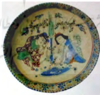
تصویر ۱۵ ب: ظرف سفالین، ایران، اواخر قرن ۱۲م (Pancaroglu 2007, 135)