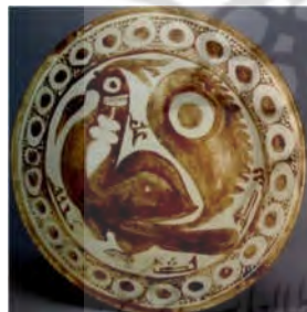
تصویر ۷: سفال لعاب‌دار مات، قرن دهم میلادی (Pancaroglu 2007, 51)