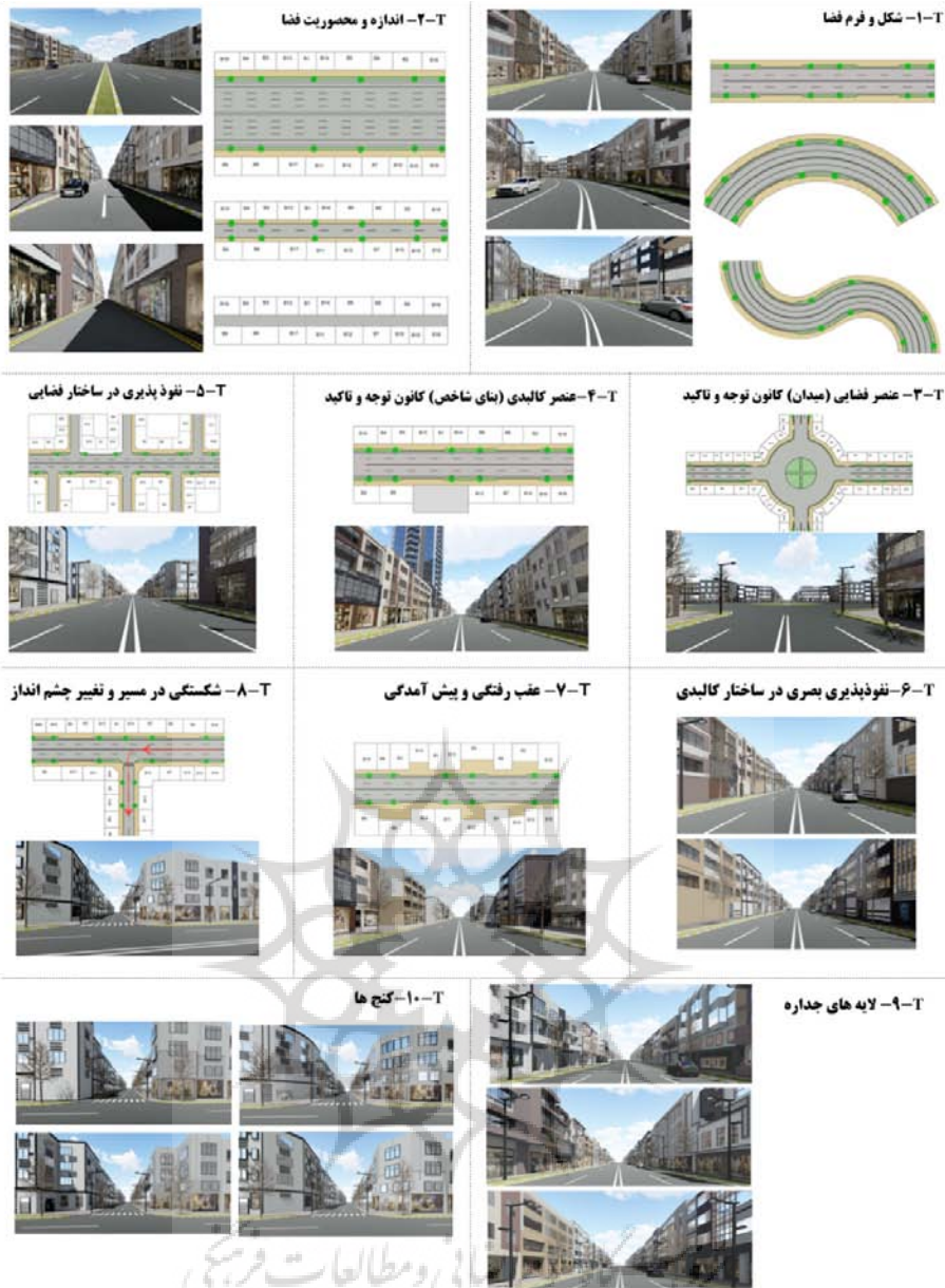
تصویر شماره ۱: تصاویری از محیط شبیه سازی شده آزمون های هجده گانه در قالب ده متغیر مورد بررسی با کنترل عوامل مداخله گر