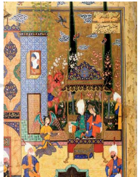
تصویر ۷. گفتگوی سلیمان و بلقیس، هفت اورنگ جامی، دوره صفوی.

حضرت عیسی نیز در مثنوی مثل آنچه در قرآن کریم آمده، همواره بنده خدا و پیامبر او ظاهر می‌شود. عیسی در قرآن روح‌الله نامیده شده و از حیث ولادت به آدم و از لحاظ فرجام حال به ادريس می‌ماند و او را از سایر انبیا متمایز ساخته است (محللاتی، ۱۳۶۸، ص. ۲۸۹). در قصه ولادت عیسی که هم در قرآن آیات ۱۶ تا ۱۹ سوره مریم و هم در دفتر سوم مثنوی آمده وقتی مریم در حال غسل کردن است، صورتی جانفزا را پیش روی خویش می‌بیند که گویی از زمین روییده، به‌شدت وحشت کرده و به حق پناه می‌برد، اما فرشته حق او را از این اظهار وحشت باز می‌دارد و عنایت حق به مریم، همان روح و نفخی را می‌بخشد که در وجود عیسی موجب شفای بیماران و حیات مردگان می‌شود (ابراهیمی، ۱۳۷۹، ص. ۸۰۶). این تصویر حاصل اغراق دل‌انگیزی است، که با کمک آن پاکی و عفت مریم نشان داده شده است. در این حالت اضطراب بی‌نهایت، مریم را همچون «ماهیان بر روی زمین» ساخته است. این فرشته «امین حضرت» در حالی که از لبانش نور می‌تراود، بر مریم بانگ می‌زدند که از من دوری