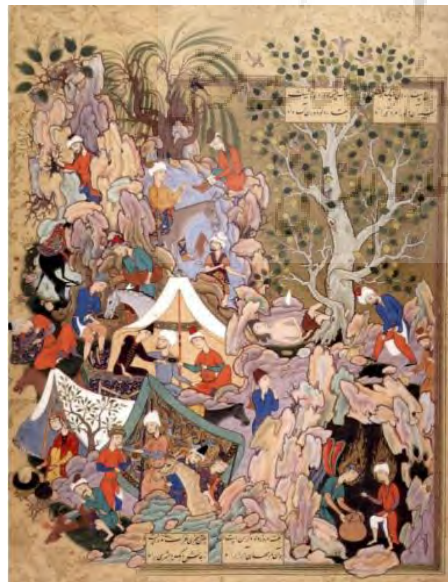
تصویر ۴. نگاره نجات یوسف از چاه، از مظفرعلی برادرزاده بهزاد، دوره صفوی. منبع: ولش، ۱۳۸۴، ص. ۱۵۳.