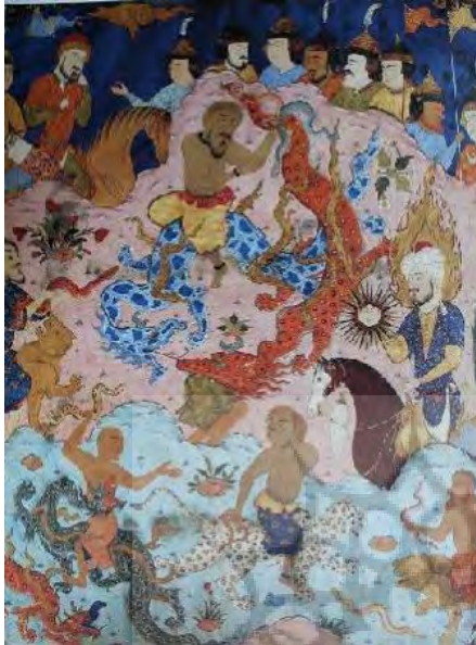
تصویر ۶. موسی و ساحران، فالنامه، دوره صفوی.

او جلب نموده است. ترکیب‌بندی این نگاره با آنچه مولانا در شرح داستان در دفتر سوم بیان کرده، هماهنگ می‌باشد.