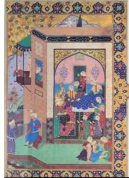
تصویر ۵. یوسف در مهمانی زلیخا، پنج گنج، ۹۲۸ ه.ق. دوره صفوی.

نام سلیمان (ع) در تاریخ به‌عنوان پیغمبری رئوف و سلطانی عادل و دادگستر و حکمرانی حکیم و فرزانه ثبت شده است. خدای تعالی سلیمان را نیز مانند پدرش داوود، به نعمت‌های بسیاری متنعم ساخت و موهبت‌های فراوانی بدو عنایت فرمود، مانند: نبوت، سلطنت، علم منطق الطیر، علم قضاوت، حکمت و فرزاندگی، تسخیر باد و جنیان، دیوان و شیاطین. آن حضرت توانست بناهای عظیم و مرتفع و شگفت‌انگیزی را مانند بیت المقدس و هیکل و سایر آثاری که هنوز هم نمونه‌های بسیاری از آن‌ها در سرزمین فلسطین و شامات موجود است، بسازد (محلّاتی، ۱۳۶۸، صص. ۲۲۹-۲۲۸). حشمت سلیمان و جنبه معنوی سلطنت او در طی قصه بلقیس جلوه می‌یابد. بر اساس آنچه در سوره نمل آیات ۲۰ تا ۴۵ در شرح داستان سلیمان و ملکه سبا، بلقیس، آمده؛ هدهد به‌عنوان پیک، نامه حضرت را به ملکه سبا می‌رساند؛ نکته‌هایی که در نامه سلیمان است، باعث می‌شود او به چته کوچک پیک نگاه نکند. همچنین مولانا در ابیاتی به این داستان اشاره کرده است (مولانا، ۱۳۷۵، ص. ۵۲۰). بلقیس که پیام سلیمان او را به درک ایمان و لقای سلیمان مشتاق می‌کند در عزیمت به دیدار وی، از همه چیز خود در ملک سبا چشم می‌پوشد و مولوی این بخش را در دفتر چهارم، توصیفی در رهایی از چنگال دیوهای نفسانی می‌داند. بلقیس از ملک و مال بیزار شده و از شوق ایمان مست می‌گردد، ولی با این همه به تخت خویش همچنان دلبسته است؛ سلیمان که می‌داند رهایی از تعلقات یکباره میسر نیست (زرین‌کوب، ۱۳۸۰، صص. ۷۹-۷۸). در این ابیات که کاربردی زیبا و شاعرانه از این حکایت بوده و جلوه‌های عارفانه آن نیز به‌خوبی مشهود است، آغاز تبدیل شدن عشق مجازی به حقیقی نشان داده شده است. نگاره زیبایی از هفت اورنگ، سلیمان و بلقیس را در تخت‌گاهی