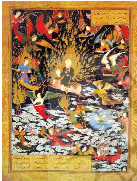
تصویر ۱۰. نگاره معراج پیامبر (۹۵۰-۹۴۶ ه.ق)، خمسه طهماسبی، دوره صفوی.

مجو، زیرا من امین بارگاه الهی هستم (پورخالقی چترودی، ۱۳۷۴، صص. ۲۳۶-۲۳۷). در نگاره‌ای از کتاب قصص النبیاء به موضوع حضرت مریم اشاره شده است (تصویر ۸). مولانا از عیسی مسیح (ع)، در دفتر چهارم و ششم مثنوی، به‌عنوان عالی‌ترین نمونه انسان کامل یاد می‌کند. تأثیری هم که نَفَس عیسی (ع) در تحقق معجزات و کرامات منسوب به او دارد، از روح الهی او که در عین حال متضمن مفهوم یکرنگی اوست، ناشی و تعبیری از همان تأثیر روحانی است؛ چنانکه آن نَفَس عیسوی که از افسون وی به جسم مرده حیات می‌بخشد و به هر رنجوری در رسد، موجب شفای او می‌گردد، نیز صورتی از همین روح عیسوی است (ابراهیمی، ۱۳۷۹، ص. ۸۰۵).