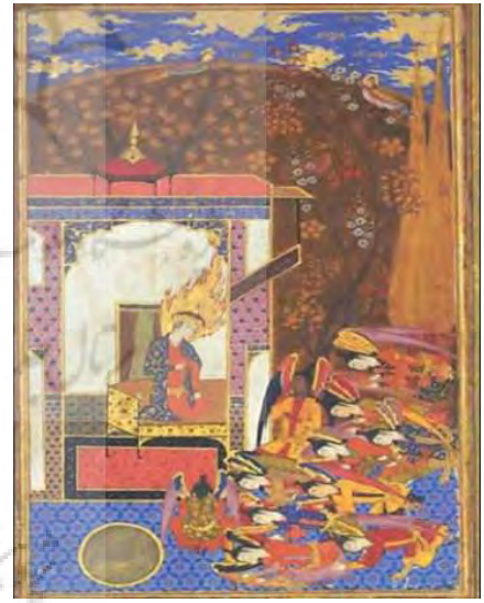
تصویر ۱. سجده فرشتگان بر حضرت آدم، حبیب‌السیبر.