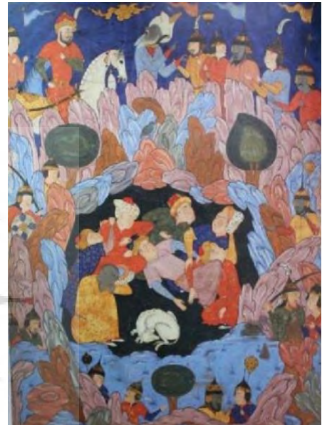
تصویر ۹. اصحاب کهف، فالنامه، دوره صفوی.

در تفاسیر قرآن کریم از جمله آیه ۷ سوره بقره و همچنین در باب عقاید صوفیان در قصه اصحاب کهف اشاره شده ۲ که روح به‌خواب رفتگان در غار در پناه خداوند، از گمراهی مصون و محفوظ بوده‌اند؛ حال مؤمنان به حق و عاشقان سیر الی‌الله نیز، که چیزی جز خدا نمی‌بینند، به عینه، مانند پناهندگان به غار هستند؛ همچنان که غار آن‌ها را محفوظ نگه داشت، الطاف بی‌کران الهی، مؤمنان و عاشقان الله را، در کنف رحمت خود خواهد گرفت. در اینجا است، که مولانا آرزو می‌کند، ارواح آدمیان هم مانند اصحاب کهف در همان حال خواب نگه داشته می‌شد یا چون راکبان کشتی نوح از خطر طوفان نَفَس محفوظ می‌ماند (ابراهیمی، ۱۳۷۹، ص. ۲۰۸). در دفتر اول مثنوی، مولانا، با توجه به آیات ۲۵ و ۲۶ سوره کهف به مدت حضور آن‌ها در غار و دانایی و توانایی خداوند در بازگرداندن روح دوباره به بدن، اشاره کرده است (مولانا، ۱۳۷۵، ص. ۳۴). مولانا اولیای حق را به اصحاب کهف تشبیه می‌کند که در هر حالت در آرامش به‌سر می‌برند، اشاره مولانا به این ابیات مربوط به آیه ۱۸ سوره کهف می‌باشد (مولانا، ۱۳۷۵، ص. ۴۲۷). (ابراهیمی، ۱۳۷۹، ص. ۲۰۹). در برگه از فالنامه، متأثر از مکتب قزوین و اصفهان، تصویری از هفت تن اصحاب کهف موجود است (تصویر ۹). مرکز تصویر شامل صخره‌ای سنگی و بزرگ است که درون آن