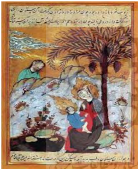
تصویر ۸. نگاره حضرت مریم و عیسی، قصص الانبیاء، دوره صفوی.

زیبا در مقابل فرشته الهی به تصویر کشیده است (تصویر ۷). بلقیس در کنار سلیمان بر روی تخت و همه افراد با پوشش صفوی در یک ترکیب‌بندی زیبا و دیگر افراد حاضر در فرمی دایره‌وار، قرار دارند. ترکیب‌بندی دیوارهای رنگین و منقوش عمارت، طبیعت زیبا و دل‌انگیز خداوند و نقوش طلایی حاشیه تصویر، از جمله ویژگی‌های زیبایی نگاره‌های دوره صفوی است، که در این اثر به‌خوبی دیده می‌شود. این نگاره، گویی مجلسی است که به بعد از حکایت ایمان آوردن بلقیس و ازدواج او با سلیمان (ع) مربوط می‌باشد. وجود یک جفت سرو بلند در پشت بارگاه و تخت سلیمان و بلقیس را می‌توان نمادی از زوجیت و پیوند میان آن‌ها دانست. این بار چهره نبی خدا، همچون برخی از نگاره‌ها در نسخه‌های مذهبی دوره صفوی، پوشیده شده است. بارگاه و تختی باشکوه، در کنار فرشته‌ای الهی، دیوی در پشت عمارت و دیگر پرندگان، تأکیدی بر داستان سلیمان و حضور همیشگی همه آن‌ها در بارگاه ایشان دارد.