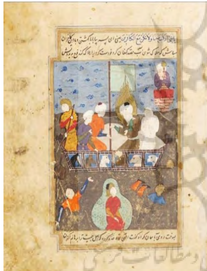
تصویر ۲. نگاره کشتی نوح، قصص الانبیاء، دوره صفوی.

اسحاق، بنابر آنچه در برخی از تفاسیر قرآن آمده، سخن به میان نمی‌آورد (ابراهیمی، ۱۳۷۹، ص. ۸۲). در نسخه‌ای از قصص الانبیاء نیشابوری محفوظ در کتابخانه ملی پاریس، از دوره صفویه، نگاره‌ای از ذبح اسماعیل به نمایش درآمده است. در این تصویر حضرت ابراهیم (ع) با عمامه‌ای سفید، پوششی سبز رنگ و هاله‌ای آتشین در حالی که خنجر در دست راست و سر اسماعیل را که بر روی زمین نشسته، در دست دیگر دارد، با نگاهی رو به آسمان و جبرئیل ترسیم شده است. در مقابل او جبرئیل با بال‌های گشاده، قوچی را برای قربانی کردن به حضرت نشان می‌دهد. حالات چهره افراد و پیچش بدن آن‌ها، گویای عمل در حال انجام است (تصویر ۳). شاخص این تصویر، همچون نقل داستان، شخصیت حضرت ابراهیم (ع) است که مورد امتحانی سخت قرار گرفته و سربلند از آن، مورد رحمت و مغفرت الهی قرار می‌گیرد و خداوند نسب پیامبران را از نسل او قرار می‌دهد. امروزه، تمامی افرادی که به زیارت خانه خدا می‌روند و حج به جا می‌آورند می‌بایست همچون ابراهیم و اسماعیل، نفس خود را قربانی کنند (صداقت، ۱۳۸۶، ص. ۳۳).