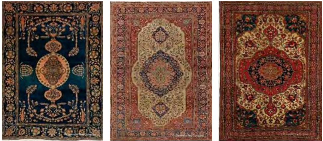
تصویر ۱۰. کیفیت غالب و مغلوب در نمونه های قالی ساروق.

۴. بهره گیری از فرم های خاص و پیچیدگی های ساختاری: از دیگر خصوصیات و ویژگی ترنج ها، بهره گیری از فرم های خاص، پیچیدگی های ساختاری و تراکم فضای آن ها توسط بندها و ریزنقش ها است؛ به گونه ای که در هیچکدام از ترنج ها فضای خالی و خلوت دیده نمی شود. ترنج ها در فرم و کالبد و نوع تزیین و آراستگی، با یکدیگر متفاوت هستند. در فضای دورن ترنج، گاهی یک یا بیشتر از یک ترنج جای گرفته است و ساختاری را شکل می دهد بدون اینکه نظم و ترکیب بندی کل ترنج را بر هم زند؛ ضمن اینکه تضادهای رنگی در فضای ترنج، هارمونی و هماهنگی بدیعی را در زمینه قالی ایجاد کرده است (تصویر ۱۱). طراح با فراهم کردن شرایطی همچون نشان دادن و خلوت کردن فضای پیرامون ترنج و بهره گیری از فرم های خاص ترنج در مرکز زمینه، فضای ترنجی را طراحی و ترسیم می نماید که سریع تر از سایر عناصر، چشم را گیرا می کند.