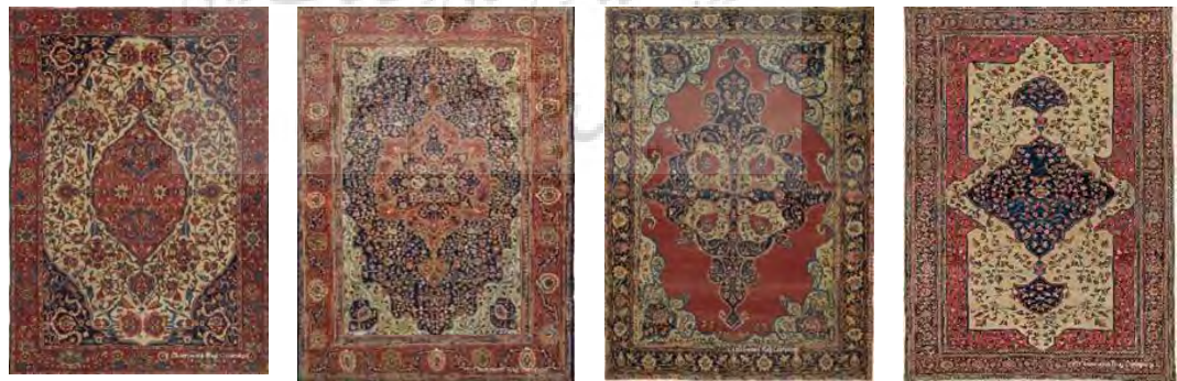
تصویر ۶. نمونه‌هایی از قالی‌های نفیس و نخبه ساروق، قرن نوزدهم.

«آرمن هانگلدین» ۸ دیگر محقق در دانش قالی‌شناسی معتقد است: «تاریخ انتشار قالی ساروق نسبتاً متأخر است (حدود نیمه دوم قرن نوزدهم میلادی)، معذالک این قالی‌ها و به‌خصوص قالی‌های قدیمی آن به‌دلیل نقش ملیح