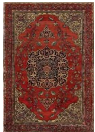
تصویر ۱۱. مؤلفه های «فضای پیرامونی» و «فرم های خاص و پیچیدگی های ساختاری» در ترنج های قالی ساروق.