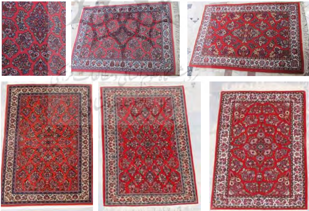
تصویر ۷. طرح و نقشه رایج دسته‌گلی امروزی شبیه و تقلید از نقشه اصیل قدیمی، بازار قالی اراک، سرای مهدیه.

از جمله نقشه‌های خاص، اصیل و قدیمی ساروق و به‌طور کلی منطقه وسیع فراهان، طرح و نقشه دسته‌گلی، است. از آنجایی که این نقشه، در آمریکا و اروپا طرفداران زیادی داشت و مورد استقبال قرار گرفت، به‌عنوان یکی از نقشه‌های اصیل قالی ساروق در جامعه فرنگ، به شهرت رسید. قالی طرح دسته‌گلی در ایران با توجه به علاقه‌ای که آمریکایی‌ها به رنگ «صورتی» یا «دوغی روناسی» ۱۲ نشان دادند، به «دوغی آمریکایی، ساروق آمریکایی، ساروق باب آمریکایی» معروف بود. «در پایان جنگ جهانی اول یک شرکت آمریکایی تجارت فرش از میان نقشه‌های متداول در ساروق و اراک طرحی توسط طراحان آن روزگار مطابق سلیقه آمریکاییان طراحی و توسط بافندگان ساروق بافته و راهی آمریکا شد که بعدها به ساروق آمریکایی شهرت یافت. فرش‌هایی دو پود با پرز بلند در اندازه‌های متفاوت در زمینه‌ای قرمز با حاشیه سرمه‌ای و یا بژ روشن با حاشیه سرمه‌ای به تعداد زیادی بافته و به آمریکا صادر شد. این طرح‌ها فاقد لچک‌های چهارگانه بوده و ترنج میانی نیز اکثراً برخلاف ترنج‌های سنتی فرش‌های ایران، فاقد خطوط حد فاصل ترنج و متن است. در متن این قالی‌ها دسته‌های گل و برگ‌های پیچیده بزرگ که اطراف آن‌ها با گل‌های کوچک پوشیده شده به‌صورت مجرد و جدا از هم دیده می‌شود» (صباحی، ۱۳۹۳، ص. ۳۵۳). امروزه نمونه‌هایی تقلیدی و شبیه از طرح دسته‌گلی در بازار اراک عرضه می‌شود که صرفاً در نقش‌مایه دسته‌گل‌ها و نه رنگ و اندازه، با قالی‌های قدیم این طرح شباهت دارد (تصویر ۷).