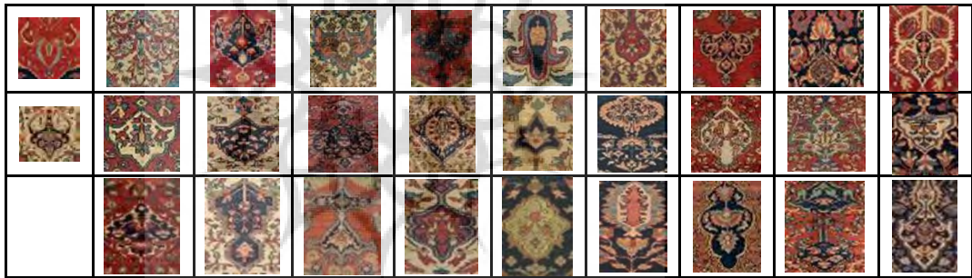
جدول ۳. انواع فرم‌های سرترنج در قالی‌های ساروق.

دومین عنصر ساختاری در فضای زمینه سرترنج است که در قالی ساروق، دارای بیانی متفاوت از منظر فرم و تزیین دارد. سرترنج یا گلاله، به بخش و نقش‌مایه دو سر ابتدایی و انتهایی ترنج گفته می‌شود. سرترنج نقش تزیین و آراستگی ترنج را بر عهده دارد. غالباً در همه طرح‌های لچک و ترنج قالی ایران، سرترنج حضور دارد؛ اما به‌طور استثنا، در برخی از طرح‌ها این عنصر وجود ندارد. در نمونه‌های انتخابی قالی ساروق، به‌جز یک مورد، همگی دارای سرترنج یا گلاله با اشکال متنوع هستند. انواع اشکال سرترنج‌ها در جدول نشان داده شده است. طراح در ترسیم سرترنج سعی وافر داشته تا از عناصر دیداری خط، سطح و حجم، نهایت بهره را ببرد؛ از این‌رو است که تنوع در سرترنج‌ها به‌گونه‌ای است که نمی‌توان یک طبقه‌بندی منطقی و معمول را ارائه کرد. نکته دارای اهمیت در این سرترنج‌ها این است که برخلاف قالی‌های سایر مکاتب ایران که سرترنج‌ها عمدتاً دارای فضایی خلوت و نسبتاً کم‌تراکم است، در اینجا دارای فضایی شلوغ و پُرتراکم می‌باشد. فرم‌های سرترنج‌ها اغلب به‌صورت اشکال قلبی‌گون و نعلبکی‌شکل است. در جدول ۳ سرترنج‌های نمونه‌های انتخابی به استثنای یک قالی که سرترنج ندارد، نشان داده شده است.