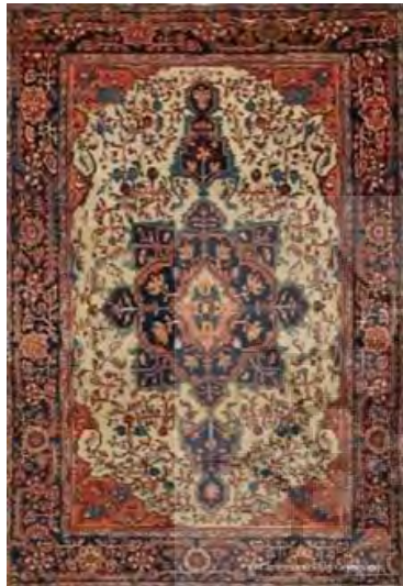
تصویر ۹. تقدم دیداری در نمونه‌هایی از قالی لچک و ترنج ساروق. منبع: https://clearmont.com

منحصر به فرد خلق می‌شود- چشم بیننده را به سوی خود جلب و متمرکز می‌کند. در واقع فضای پیرامونی با پوشش و پشتیبانی موجب می‌شود نخست فضای ترنج به دیده درآید. گویی همه عناصر به اراده طراح، برآند تا ترنج به‌طور صریح و ضمنی چشمگیرترین آرایه زیباشناختی و نمادین، در متن قالی به‌شمار آید و تسلط و تمرکز چشم بیننده را نخست به‌خود جلب می‌کند و جلوتر از همه عناصر به‌نظر آید؛ البته این فن و قاعده تجسمی نسبی بوده، صرفاً در اغلب نمونه‌های حاضر دیده شده و جلب نظر می‌کند؛ بنابراین مؤلفه‌ای دائمی و مطلق در منظومه تجسمی و بصری نیست (تصویر ۹).