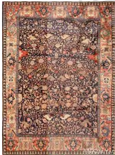
تصویر ۸. نمونه‌هایی از قالی

قالی‌های ساروق مجموعه کلرمونت، از منظر ساختار و عناصر دیداری نسبت به قالی‌های هم‌عصر خود (اواخر قرن نوزدهم و اوایل قرن بیستم)، دارای ساختار ویژه و عناصر دیداری متفاوت و متنوع در متن خود است؛ چه اینکه ویژگی‌های یاد شده، اگر در همه قالی‌های ساروق و فراهان در برهه‌های مختلف دیده نشود، حداقل در نمونه‌های مورد مطالعه به خوبی نمودار است. یکی از ویژگی‌های چشمگیر در نمونه‌های یاد شده این است که نقش‌پردازی به صورت متراکم انجام گرفته و تمام فضای قالی منقش به نقش‌مایه‌ها و گل و بوته‌ها و بندهای ریز و درشت است (تصویر ۸). در واقع طراح از واگذاری و فضای تهی اجتناب کرده است نگرشی که جزئی از زیبایی‌شناسی هنر ایرانی است. «اگر در کهن‌ترین آثار هنری ایران توجه کنیم، می‌بینیم که تمامی گستره اثر از عناصر و شکل‌های ریز و درشت پوشانیده شده. این پوشندگی گاهی تا آن اندازه پیش می‌رود که عناصر ترکیب، در یکدیگر ادغام می‌شوند یا بر هم اثرگذار می‌گردند. از دیدگاه زیبایی‌شناسی، نه تنها عیب و نقصی در اینگونه ترکیب‌بندی‌ها وجود ندارد؛ بلکه بسیاری از شاهکارهای جاویدان هنری اینگونه به وجود آمده‌اند. ما این نظام پوشندگی را زیبایی‌شناسی پرهیز یا نفرت از فضای تهی می‌نامیم» (آیت‌اللهی، ۱۳۸۸، ص: ۱۴۴).