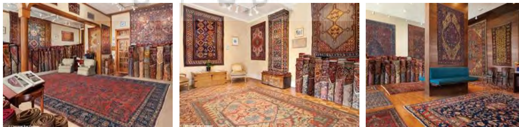
تصویر ۵. نمایی از مجموعه بزرگ کلرمونت در آمریکا.

کمپانی کلرمونت در سال ۱۹۸۱ میلادی (۱۳۵۹ خورشیدی) در آمریکا و توسط «جان دیوید وینیتز» بنیان‌گذاری و تأسیس شد. این کمپانی یکی از مهمترین و برجسته‌ترین مجموعه‌هایی است که در بحث قالی‌های ارزشمند کلکسیون، دارنده نفیس‌ترین و کم‌یاب‌ترین قالی‌های قدیمی ایران به‌ویژه قالی‌های ساروق، فراهان و سلطان‌آباد است که در قرن نوزدهم میلادی تولید شده‌اند. برخی از قالی‌های نفیس و گران‌قیمت ایرانی که در حراجی‌های کریستی فروخته شده، متعلق به مجموعه و شرکت کلرمونت بوده است. رئیس این کمپانی سال ۲۰۱۰ را «سال قالی» نامگذاری کرد؛ چه اینکه فروش خارق‌العاده قالی‌های کم‌یاب گنجینه این شرکت در حراجی‌های مشهور، مصداقی بر این نامگذاری است. قالی‌های بزرگ پارچه بافت ساروق فراهان و سلطان‌آباد مجموعه کلرمونت، مربوط به حدود سال‌های ۱۸۰۰ تا ۱۹۱۰ میلادی است که با هدف صادرات به آمریکا و اروپا توسط شرکت‌های خارجی به‌ویژه زیگلر تولید شدند (تصویر ۵).