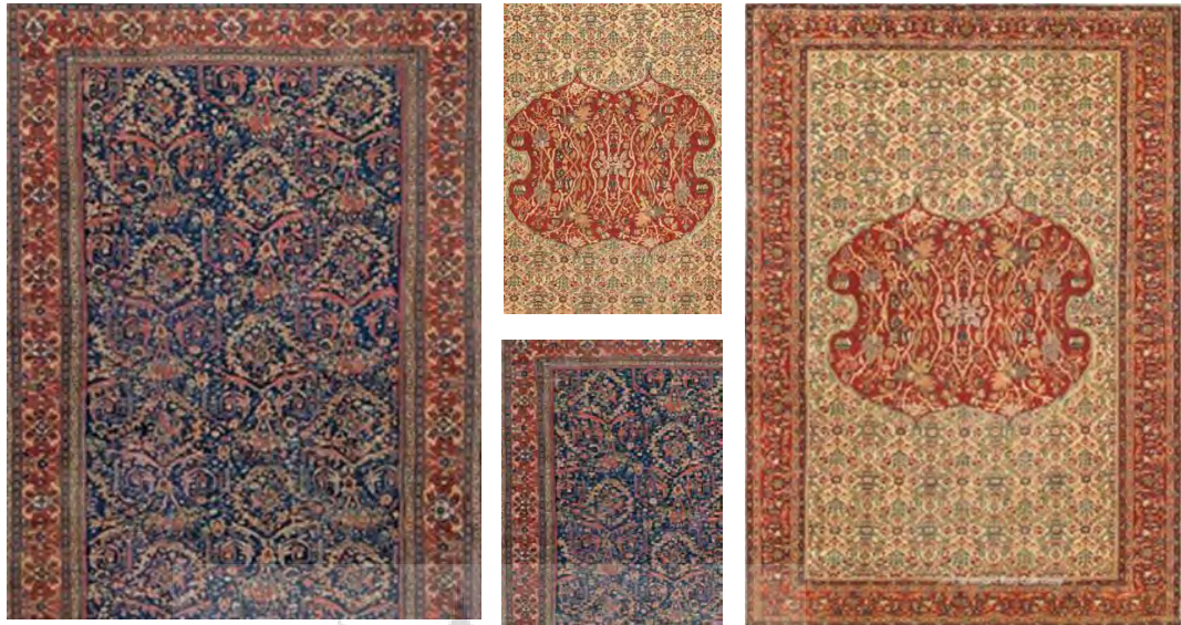
تصویر ۴. نمونه‌هایی از تولیدات زیگلر، طرح‌بندی (بالا) و مستوفی (پایین).