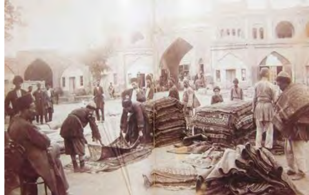
تصویر ۱. بازار قالی و عدل‌بندی در دوران قاجار.