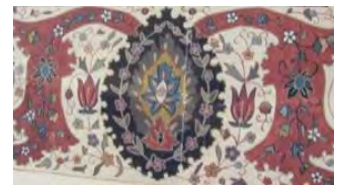
تصویر ۳. نمونه نقشه‌ها و اتودهای اولیه شرکت زیگلر، مجموعه حقدادی.