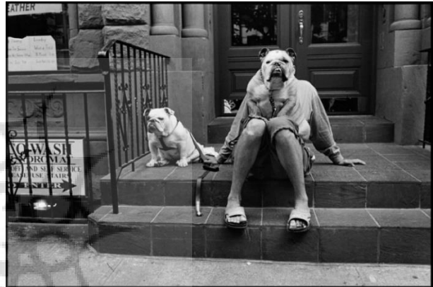
تصویر ۱. الیوت ارویت، ایالات متحده، نیویورک،

طنز «الیوت ارویت» ۳۵ در برخی عکس‌هایش را مد عکاسی او دانست. «جان سارکوفسکی» ۳۶ ، مدیر عکس موزه هنر مدرن ۳۷ ، در نگاهی به عکس‌ها ۳۸ برای شرح آنچه که ارویت انجام می‌دهد، به ساز و کار رسانه عکاسی پرداخته و عنوان می‌کند که هیچ رسانه‌ای تا به حال واقعیت بصری را به دقت و وضوح عکاسی ثبت نکرده است و این امر را نقطه ضعف عکاسی می‌داند. اما کسی قادر است مثل الیوت ارویت از این ناتوالیسم سطحی ۳۹ در جهت بیان حقایق فلسفی و کلی استفاده کند (سارکوفسکی، ۱۳۸۲، ص. ۳۱۵). برای نمونه می‌توان به مجموعه سگ‌های ارویت اشاره کرد (تصویر ۱) که در آن، او با استفاده از این قابلیت رسانه، تناقضاتی را به تصویر می‌کشد که همزمان با به چالش کشیدن واقع‌نمایی عکاسی در پس طنز بصری ایجاد شده در عکس‌هایش، به تلاش برای بیان مفاهیمی عمیق می‌پردازد.