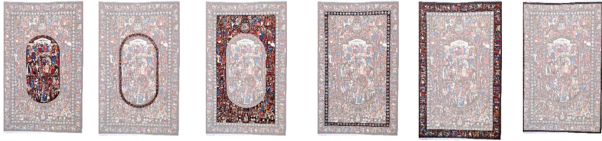
الف-حاشیه بیرونی ب-حاشیه بزرگ پ-حاشیه درونی(نام شاهان) ت-زمینه خارج از بیضی ث-قاب دور بیضی (نام مشاهیر) ج-داخل بیضی (تصاویر مشاهیر)

تصویر ۲. لایه‌های مختلف قالی مشاهیر یا رهبران جهان. مأخذ: نگارندگان.