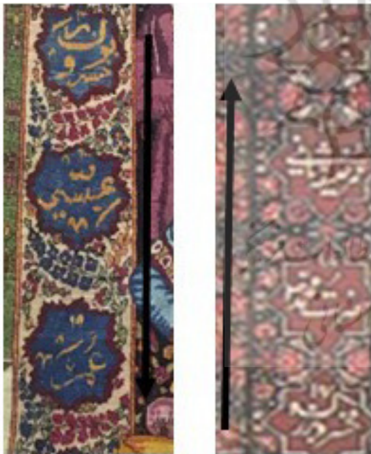
تصویر ۹. راست: قسمتی از حاشیه قالی‌های موجود در موزه فرش؛ چپ: قسمتی از حاشیه قالی‌های موجود در موزه کاخ نیاوران.

مسیحی، سفارشی توسط مسیحیان بوده یا هدیه‌ای به آنان باشد. لذا تقلیل یافتن آگاهانه موقعیت‌های صحنه و کارکرد این حق تقدم، بر تقویت این انگاره که وولف از آن به عنوان احاطه موضوع و قدرت با محور زبانی شناسی یاد می‌کند، تلاقی جدل برانگیزی است که قابلیت تأویل معنایی گوناگون رامیسر می‌کند.