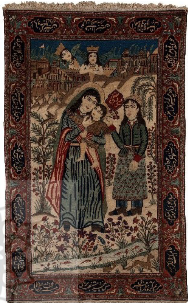
تصویر ۸. کاشان، ۱۳۰×۲۷۰ سانتی‌متر، فرش محتشم کاشان، حضرت مریم و مسیح (ع)، دوره قاجار.

هر اثری به مثابه تولیدی است که با توجه به اظهارات جانت ولف