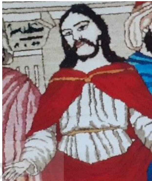
تصویر ۱۰. جزئی از تصویر قالی محفوظ کاخ نیاوران، حضرت عیسی (ع) و نام وی بر ستون نزدیک آن.