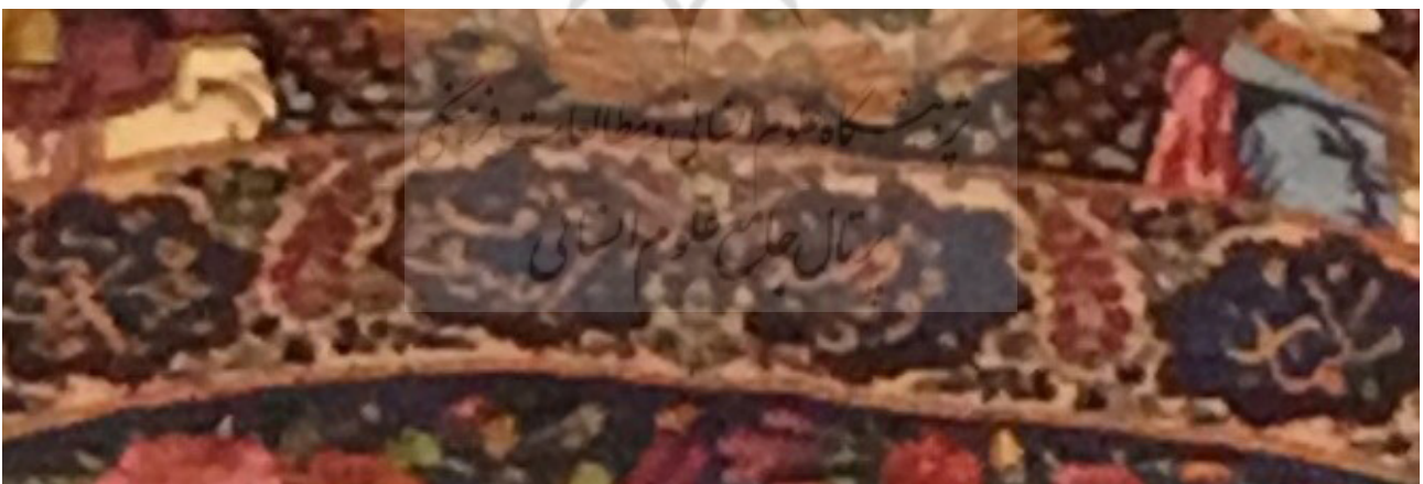
تصویر ۷. قاب بیضی شکل. اسامی از راست به چپ سلیمان (شماره ۲)، موشه (موسی) (شماره ۱)، ناپلئون (شماره ۵۴).

صورت گرفته است. حضور مبلغین مسیحی در دوره قاجار از دوره فتحعلی‌شاه و از دوره ناپلئون بناپارت با فتوحات گسترده‌ای که داشت بیشتر شد (مهدوی، ۱۳۶۴، ۲۱۱). ناپلئون به گاردان، متخصصینی در زمینه پزشکی، مهندسی، نظامی و مذهبی را به ایران اعزام کرد. دنلی حضور دو کشیش در میان این اعضا را اشاره به دیدگاه آن دوره به مسیحیت می‌داند (دنلی، ۱۳۸۳،