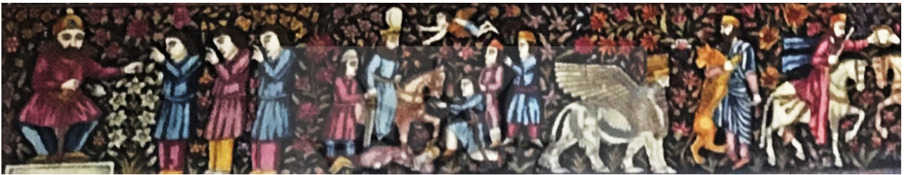
تصویر ۳. جزئیاتی از حاشیه دوم. قالی محفوظ در کاخ نیاوران تصاویری از نقش برجسته‌های ایران باستان.

تصویر ۲. لایه‌های مختلف قالی مشاهیر یا رهبران جهان.