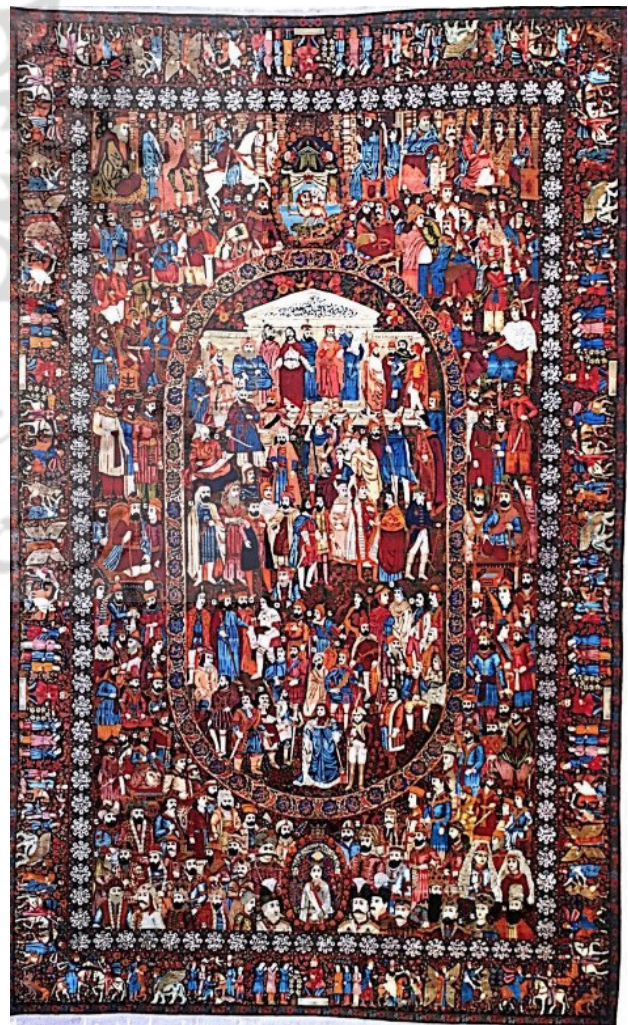
تصویر ۱. قالیچه مشاهیر، قرن ۲۰، محفوظ در کاخ نیاوران

نسبت اول، A با C نسبت به نقطه M (مرکز فرش) قرینه است (تصویر ۴، نمونه ۱). نسبت دوم، B با C نسبت به محور X۱، و B۲ با A۲ نسبت به محور X۲ قرینه است (تصویر ۴، نمونه ۲).