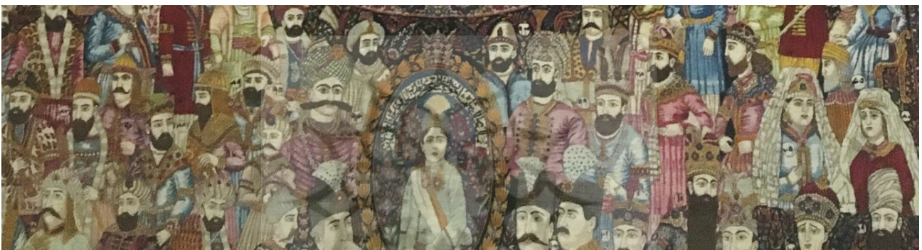
تصویر ۶. جزئیاتی از تصویر پادشاهان ایران که به احمدشاه ختم می‌شود.