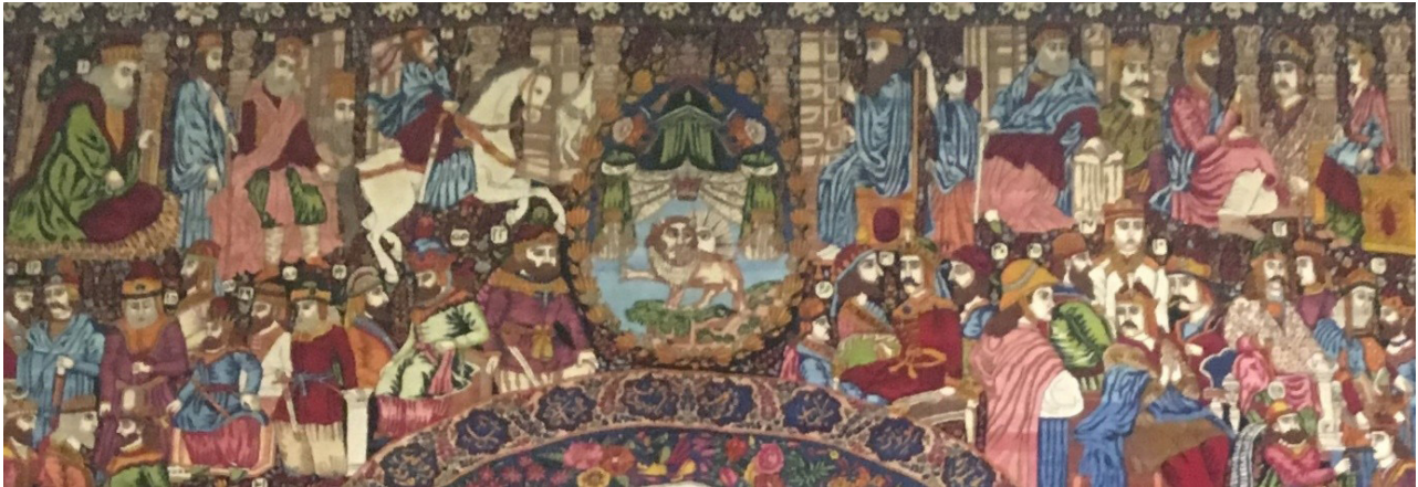
تصویر ۵. جزئیاتی از تصویر پادشاهان ایران که با کیومرث، پیکره سمت چپ آغاز می‌شود.