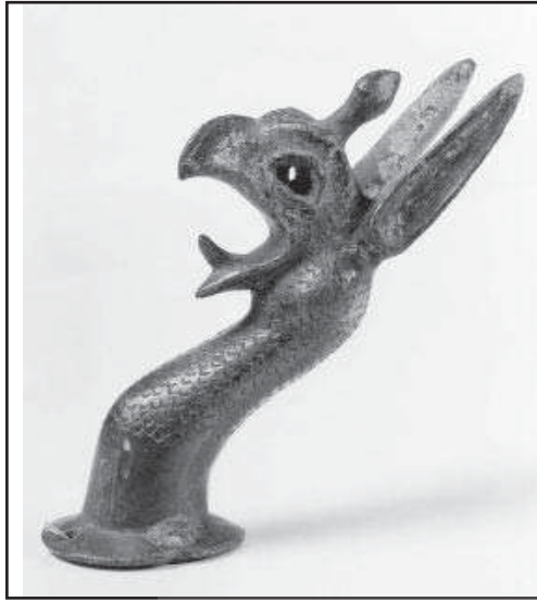
تصویر ۱۷. سردیس فلزی گریفین حدود ق.م، یونان.