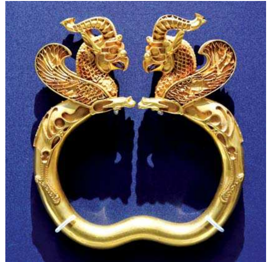
تصویر ۶. بازوبند طلا با تزیین گریفین، دوره هخامنشی، مأخذ: Pope, 1958: pl. 182

آن‌ها محسوب می‌شدند. یک نمونه از این ظرف‌ها از یک مقبره در سالامیس ۱ قبرس به دست آمده است (Osborn, 1998: 42-48). به مرور زمان طی قرن هفتم و پس از آن، نفوذ هنر شرقی و نقش‌مایه‌های این سنت در هنر یونان بیشتر شد. این تأثیر بر نقش‌مایه گریفین به صورت استفاده از این نقش‌مایه بر روی سفال‌های شرق یونان و نیز سفال‌های کرنتی نمود پیدا می‌کند. در مواردی حتی بر روی جواهرات نیز از این نقش‌مایه استفاده شده است (ibid: 65). بر روی سفالینه‌های یونانی که در شیوه‌های سرخ‌گون و سیاه‌گون تزیین شده‌اند، نقش‌مایه گریفین بسیار استفاده شده است (تصاویر ۲۰-۱۹). ارتباط گریفین با آپولو و نیز آتنا و دیونیسوس سبب شده تا این موجود اسطوره‌ای را در کنار نقش این خدایان بر روی سفالینه‌ها نقاشی کنند. گریفین به‌عنوان یکی از گردانندگان ارابه دیونیسوس و یا آپولو نمود پیدا می‌کند. آپولو را می‌توان سوار بر پشت گریفین مشاهده نمود و سپر آتنا نیز با نقش‌مایه گریفین تزیین شده است. جنگ گریفین با موجودات دیگر و یا حمله او به حیواناتی مثل اسب نیز از جمله مضامین مورد توجه بر روی این سفال‌ها محسوب می‌شود (تصاویر ۲۰-۱۹).