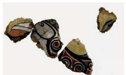
تصویر ۱۵. بخش‌هایی از یک نقاشی فرسک با نقش گریفین، دوره میسنی. مأخذ: Morgan, 2010: 320