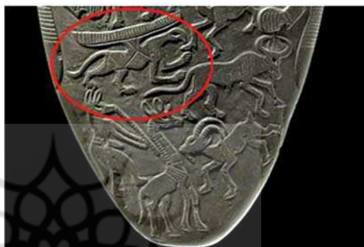
تصویر ۲. نقشمایه گریفین به دست آمده در حفريات نخب، مصر.

(Moortgate, 1940: 126). پرسش بسیار مهم در رابطه با گریفین در واقع در باب واقعی یا افسانه‌ای بودن این موجود است، (جابر انصاری، ۱۳۸۷: ۱۰۰). آدرین مایر ۲ ، احتمال وجود جانوری با ویژگی‌های فیزیکی گریفین را ممکن می‌داند. بخشی از مطالعات او بر کشفیات زیست‌شناسانه مبتنی است و ضمناً تلاش دارد تا بر اساس این مطالعات، اسطوره‌های یونان و رم را توضیح دهد (همان: ۱۰۰). او در این رابطه کتابی به رشته تحریر در آورده است. فصل اول کتاب به گریفین اختصاص دارد. مایر در این فصل یک نوع دایناسور کوچک شاخ‌دار به نام Protoceratops ۳ را معرفی می‌کند که از نظر او با گریفین ارتباط و شباهت‌های فیزیکی دارد. این دایناسور از راسته شاخ‌چهرگان است و مایر این ویژگی را با فرم شاخ‌مانندی که بر روی سر گریفین‌های غربی اضافه شده، مرتبط می‌کند. اگرچه این نوع دایناسور بالدار نیست اما مایر اضافه کردن تخیلی بال‌ها را به Protoceratops نتیجه فرآیند اساطیری شدن آن و تولد نقش‌مایه گریفین می‌داند (Mayor, 2000: 17).