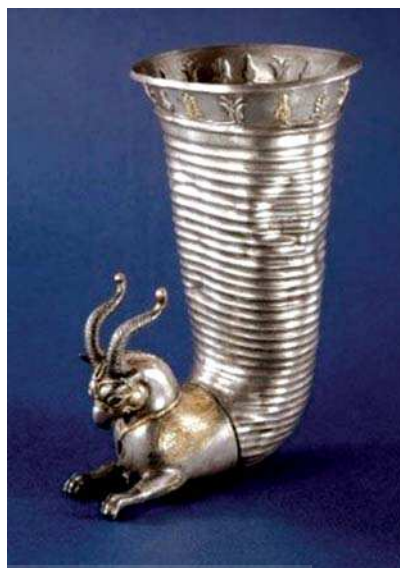
تصویر ۸. ریتون با پیکره انتهایی به شکل گریفین، دوره هخامنشی

۲۴۳) اما از دوره اشکانی گربه وحشی جایگزین شیر می‌شود و حتی شیوه‌های بازنمایی آن تغییر می‌یابد. در دوره ساسانی شدت تغییرات بسیار بیشتر است و شکل گریفین از ترکیب انواع متنوع گربه‌سان‌ها و یا حیوانات درنده‌ای با دم بسیاری از پرندگان ساخته شده است. شکل و فرم گریفین در یونان تنوع و تغییر شکل حاکم بر تصویر گریفین در ایران را در نمونه‌های یونانی نمی‌توان مشاهده نمود. نمونه‌های میسنی با نمونه‌های یونانی تفاوت چندانی را از لحاظ شکل و ساختار نشان نمی‌دهند، در حالی‌که در ایران نقش‌مایه گریفین نه تنها به مرور دچار تغییرات بسیاری در اجزاء و شیوه نمایش می‌شود بلکه نقوش جدیدی مثل سیمرخ نیز از آن متولد می‌شوند. به نظر می‌رسد هنرمندان یونانی این موجود را تنها به عنوان حیوانی اساطیری پذیرفته، مجذوب ترکیب رازآلود آن شده‌اند. ترکیب‌های این موجود در اغلب موارد یک حیوان گربه‌سان را با سر عقاب نمایش می‌دهند که زبانی بلند و کشیده دارد. این زبان بلند جز در چند نمونه محدود مربوط به دوره اشکانی، در ایران دیده نشده و احتمالاً به تأثیرات هنر هلنی بر هنر اشکانی مرتبط است. به همین ترتیب استفاده از شاخ، آن‌طور که در ایران متداول است در نمونه‌های یونانی هرگز مورد توجه قرار نگرفته است.