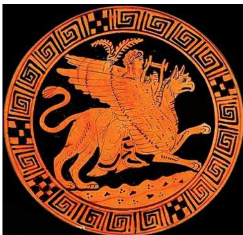
تصویر ۱۹. تصویر آپولو سوار بر پشت گریفین، نقاشی سرخ‌گون بر روی سفال، قرن پنجم قبل از میلاد، یونان