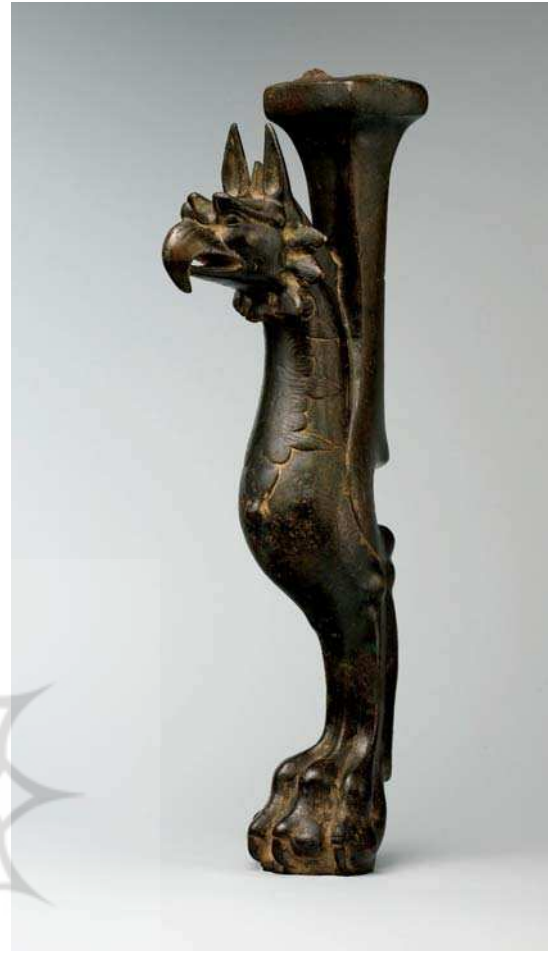
تصویر ۱۰. پایه تخت به شکل گریفین، دوره ساسانی، مأخذ: Pope, 1958: pl. 15