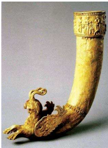
تصویر ۹. ریتون با پیکره انتهایی به شکل گریفین، دوره اشکانی مأخذ: URL11