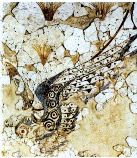
تصویر ۱۳. تصویر بال گریفین که بر روی دیوار یک کاخ در میسنی نقاشی شده است مأخذ: Bietak, 1996: 55

به همان اندازه که مفاهیم نمادین مرتبط با عقاب، در حیوان گریفین تجلی می‌کند، شیر نیز، سطح وسیعی از مفاهیم نمادین را به این حیوان می‌دهد. شیر در ایران با نماد خورشید ارتباط دارد. صفات این حیوان به قدری اهمیت داشته که بدون هیچ تردیدی آن را نماینده کامل خدای خورشید و پادشاه به کار برده‌اند، (جابز، ۱۳۸۰: ۷۸-۷۵). در بندهش شیر در گروه "گرگ‌سردگان" در کنار جانورانی مانند ببر و پلنگ قرار می‌گیرد که به آن‌ها کوتاه‌تاز می‌گویند (بندهش، ۱۳۹۷: ۱۰۰). در طول زمان انواع گربه‌سانان همچون گربه وحشی و ببر جایگزین شیر در نقش‌مایه گریفین می‌شوند.