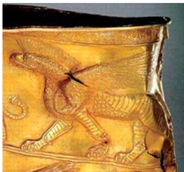
تصویره. نقشمایه گریفین بر روی بخشی از جام مارلیک.