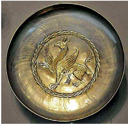
تصویر ۱۱. بشقاب فلزی بانقش برجسته گریفین، دوره ساسانی، مأخذ: Pope, 1958: pl. 240