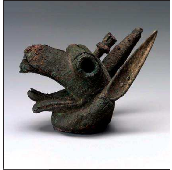
تصویر ۱۶. سردیس فلزی گریفین حدود قرن هفتم ق.م، یونان.

بود» (همان: ۵۷). استفاده از شاخ به عنوان نشان الوهیت از دیرباز در ایران و بین‌النهرین متداول بوده است. مجموعه نیروهای نسبت داده شده به گریفین همچون نیروی حمایت‌کننده و نگهبان، در کنار صفت‌هایی مانند قدرتمندی، وفاداری، نجابت و شرافت را نبایستی تنها ویژگی‌های این موجود دانست. در برخی اسطوره‌ها و روایت‌ها، نیروهای شر را نیز به این حیوان نسبت داده‌اند. به طور مثال در حماسه بابلی انوما الیش ۱ . در این اسطوره مردوک ۲ (خدای پهلوان) با دیوان پیر (تیامات ۳ ) مبارزه می‌کند. جانوران خیالی شبیه به گریفین در جنگ میان مردوک و تیامت حضور دارند. در برخی نقوش به دست آمده و مربوط به این حماسه، صحنه جنگ مردوک با جانوری که نیمی شیر و نیمی عقاب است، نشان داده شده است (مک کال، ۱۳۸۶: ۹۱).