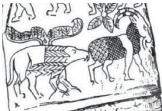
تصویر ۳. نقشمایه گریفین به دست آمده در حفريات جبل التعريف، مصر. مأخذ: Wing, 2015: 157