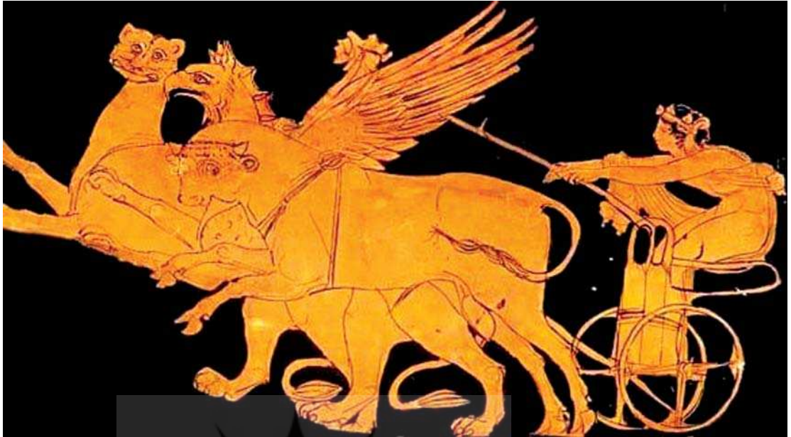
تصویر ۲۰. نقاشی گریفین به شیوه سرخ‌گون بروی سفال، گریفین ارا به دیونیسیوس رامی کشد، قرن پنجم قبل از میلاد، یونان

بازنمایی گریفین متنوع هستند و بر اساس مطالعه حاضر، گریفین در هشت الگوی ثابت و متفاوت بازنمایی شده است که عبارتند از: