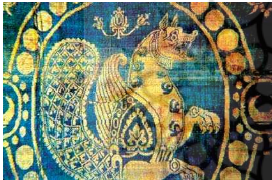
تصویر ۱۲. نقش پارچه به شکل گریفین و یا سیمرغ، دوره ساسانی، مأخذ: Pope, 1958: pl. 256