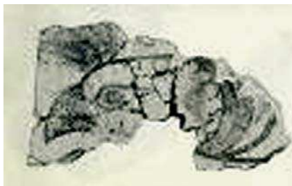
تصویر ۱۴. نقاشی سریک گریفین در نقاشی‌های دیواری دوره میسنی