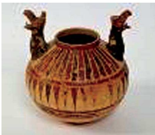
تصویر ۱۸. ظرف سفالین با دسته‌هایی به شکل گریفین، حدود قرن هفتم ق.م، یونان. مأخذ: URL:6

با مفاهیم نمادین در هنر ایران و یونان به شیوه‌های مختلف بر روی آثار و اشیاء متفاوت به کار برده شده است. بررسی شیوه‌های به کار بردن نقشمایه نشان دهنده تفاوت نوع نگاه اساطیری به این موجود در فرهنگ ایران و یونان است.