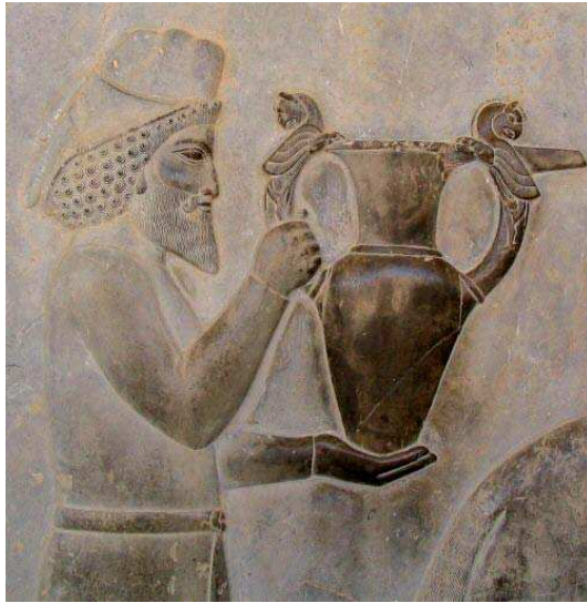
تصویر ۷. نقش برجسته تخت جمشید، نقش ظرف با دسته‌هایی به شکل گریفین، مأخذ: گریشمن، ۱۳۷۱: ۲۲۰.