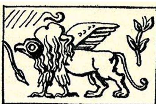
تصویره قدیمی‌ترین نمونه گریفین عیلامی، مأخذ: هینتس، ۱۳۷۱: ۸۹.

«سیمرغ» نیز دیده می‌شوند. در حقیقت، در اغلب موارد به جز دم بلند و پرپشت شبیه به دم طاووس نمی‌توان وجه تمایز دیگری میان نقش شیر دال‌ها و سیمرغ‌های ساسانی قائل شد (تصاویر ۱۲-۱۰).