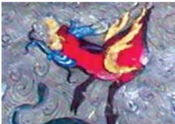
تصویر ۸. اژدها در نگاره مولانا و دیوآب، جزیی از تصویر ۲