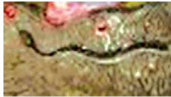
تصویر ۴. مار در نگاره مولانا و دیوآب-جزیی از تصویر ۱