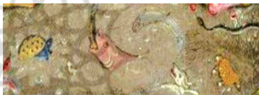
تصویر ۹. جزیی از تصویر شماره ۱

و خداوند جن را در پنج صنف آفریده است: صنفی مانند باد در هوا (ناپیدا هستند) و صنفی بصورت مارها و صنفی بصورت عقرب‌ها و صنفی حشرات زمین‌اند و صنفی از آنها مانند انسان نند که بر آنها حساب و عقاب است" ( مکارم شیرازی، ج ۲۵، ۱۳۷۷، ۱۵۷).