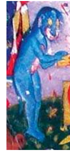
تصویر ۱۲. ظاهر حیوانی جن در نگاره مولانا و دیو آب، جزیی از تصویر ۲

مختلط و متحرک آتش آفریده شده است که به عبارتی در اینجا منظور از اختلاط شعله‌های مختلف آتش می‌باشد، زیرا هنگامی که آتش شعله‌ور می‌شود گاه به رنگ سرخ، گاه به رنگ زرد، گاه به رنگ آبی درمی آید، بنابراین شاید انتخاب رنگ آبی برای جن در این نگاره، اشاره به این تفسیر داشته‌است. چراکه نگارگر مسلمان هیچ‌گاه جدا از اعتقادات دینی و مذهبی خود به تصویرسازی نسخه‌های مذهبی نپرداخته‌است. در این بخش از نگاره‌ها با تصویری مواجه می‌شویم که با توجه به متن روایت در ثواقب‌المناقب از آن به "خداوند آب" تعبیر شده است ولی با توجه به جمیع موارد ذکر شده، می‌توان آن را تعبیر به "جن" کرد. محتمل است که این جن (تصویر ۱۱ و ۱۲) رئیس طایفه جنیان بوده که به نیابت از طایفه خود، بر حضرت مولانا ظاهر شده و تقاضای شفاعت و بخشش کرده‌است چرا که در بخش‌های پیشین به تفصیل در مورد اثبات زندگی جمعی جنیان صحبت به میان آمده‌است. در این تصاویر می‌بینیم که جن پس از قبول شفاعت خود توسط مولانا، برای ابراز سپاس از ایشان مقداری مروارید غلطان از قعر آب، به همسر مولانا تقدیم می‌کند. در نهایت جمع‌بندی مصداق‌های تصویری جن در نگاره‌ها در جدول شماره ۱ آمده‌است. لازم به ذکر است که این جدول تنها ویژگی‌های ظاهری جن را مشخص کرده و ویژگی‌های رفتاری جنیان در قرآن و مطابقت آن با حکایت مولانا در متن مقاله به تفصیل بررسی شده‌است.