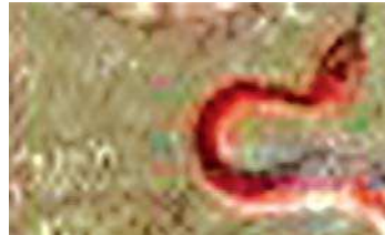
تصویر ۳. مار در نگاره مولانا و دیوآب-جزیی از تصویر ۱