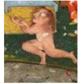
تصویر ۱۱. تصویر جن در نگاره مولانا و دیو آب، جزیی از تصویر ۱

یا حتی انسان با ظاهری عجیب غریب درآیند" (مولوی مقدم، ۱۳۹۲، ۲۶). همانطور که در تصاویر شماره ۱۱ و ۱۲ آمده‌است، جن می‌تواند ظاهری نیمه انسان و نیمه حیوان نیز داشته‌باشد که این موضوع در تفسیر طوسی آمده‌است. "برخی از جن‌ها ممکن است بدن انسان یا سر حیوان داشته باشند یا دست و پایشان مانند دست و پای حیوانات باشد" (طوسی، ۱۳۴۵، ۴۸۶).