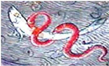
تصویر ۵. مار در نگاره مولانا و دیوآب-جزیی از تصویر ۲

بازگشایی مفهوم جن در قرآن و تطبیق آن با نگاره مولانا و دیوآب در نسخه ثواب المناقب بر اساس نقد اسطوره‌ای نورتروپ فرای / ۶۹-۷۷