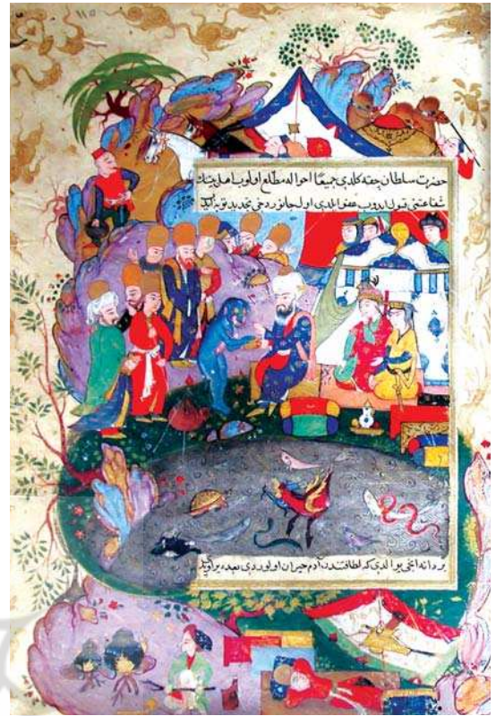
تصویر ۲. نگاره مولانا و دیو آب، موزه توپ‌قاپی استانبول، به شماره روان ۱۴۷۹.

بغداد عثمانی، تصویرسازی شده‌است. این نسخه اکنون با ۲۹ نگاره در موزه مورگان نیویورک به شماره ام. ۴۶۶ نگهداری می‌شود. نسخه مصور بعدی در سال ۱۰۰۸ ه (۱۵۹۹ م) و بازم به شیوه بغداد عثمانی، تصویرسازی شده و اکنون به شماره روان ۱۴۷۹ در موزه توپ قاپی استانبول در حال نگهداری است. از هر دو نسخه مصور نگاره مربوط به مولانا و جن انتخاب شده‌است. تصویر اول از نسخه مورگان به شماره ام. ۴۶۶ می‌باشد و تصویر دوم مربوط به نسخه توپ‌قاپی به شماره روان ۱۴۷۹ است.