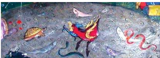
تصویر ۱۰. جزیی از تصویر شماره ۲