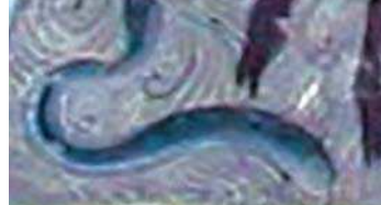
تصویر ۶. مار در نگاره مولانا و دیوآب-جزیی از تصویر شماره ۲