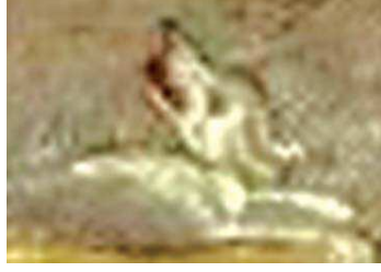
تصویر ۷. سگ در نگاره مولانا و دیوآب-جزیی از تصویر ۱