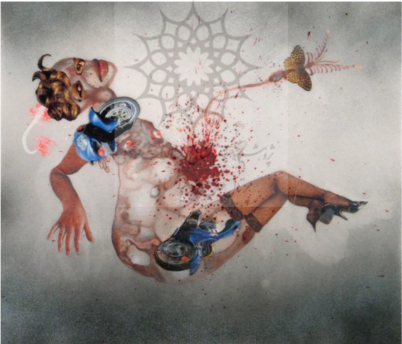
تصویر ۲. وانگچی موتو، بدون عنوان، ۲۰۰۴، کلاژ و نقاشی بر روی مخمل، ۴۷*۴۴*۴۷. مأخذ: Holzwarth, 2009, 170.

کارهای موتو را می‌توان به دسته‌های: کلاژ، مجسمه ۲ (تصویر ۱)، چیدمان و ویدئو آرت ۳ تقسیم کرد. آثار وی در سراسر جهان به نمایش گذاشته شده است؛ از جمله نمایشگاه‌های انفرادی موتو می‌توان به «دویچه گوگنهایم» در برلین، «مرکز هنرهای معاصر ویلز» در بروکسل، «موزه هنر ناشر» در دانشگاه دوک و «موزه هنرهای مدرن سان فرانسیسکو» اشاره کرد. از موتو در سال ۲۰۱۰ توسط مؤسسه Deutsche Bank به‌عنوان هنرمند سال تقدیر شد. این جایزه شامل یک نمایشگاه انفرادی در دویچه گوگنهایم در برلین بود. همراه با گسترش نهضت استقلال در بسیاری از کشورها در اواخر دوران استعمار، تنشی ملموس بین هویت و تعلیم ایجاد شد. یکی از نتایج این تنش «اسکیزوفرنی در هنرها» است. هنرمندان آفریقایی نیز خواسته‌اند در صحنه جهانی حضور یابند تا نشان دهند آفریقا نیز بازیگری در صحنه است