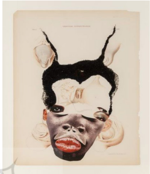
تصویر ۳. وانگچی موتو، هایپوترافی دهانه رحم، ۲۰۰۵، از مجموعه بافت‌شناسی طبقات مختلف تومورهای رحمی (۲۰۰۴-۲۰۰۵)، ۳۲/۴*۴۵/۷.

دست یابد. برخلاف دیگر تصاویر این مجموعه، موتو در این اثر از تصویر کلاژ سر یک مرد به عنوان پایه کار استفاده کرده است. بالای لب‌های اغراق‌شده پرتره که هم ارجاع به نژاد و هم جذابیت‌های جنسیتی تعریف‌شده در بازار فروش زیبایی است، یک پرند (خفاش) به شکل برعکس جایگزین سبیل شده است. هر گوش متعلق به یک نژاد است، یکی سفید و دیگری سیاه. تعداد چشم‌ها در این پرتره به سه عدد می‌رسد که یکی از آن‌ها دارای آرایش غلیظی است؛ همچنین حالت خواب‌آلوده چشم‌ها به بیننده حس بیمارگونه‌ای را منتقل می‌کند؛ به نظر می‌رسد هر کدام از این چشم‌ها متعلق به شخص متفاوتی است و هریک به نقطه‌ای خیره شده‌اند. در قسمت پیشانی، تصویرسازی راهنمای کتاب پزشکی دیده می‌شود که اندامی زنانه را تشریح می‌کند. در قسمت موی سر پرتره موتو از یک بافت نقطه‌مانند تیره استفاده کرده است که از بالای پیشانی به سمت گوشه‌های فوقانی تابلو در حرکت هستند و تداعی‌کننده حالتی شبیه به شاخ حیوانات است که در ماسک‌های اقوام بدوی آفریقایی نیز مشاهده می‌شود و نمادی از قدرت است.