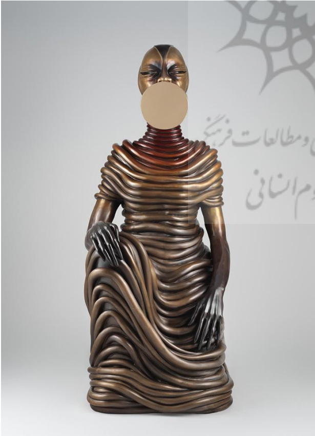
تصویر ۱. وانگچی موتو، نشسته ۱، برنز، موزه متروپولیتن، ۲۰۱ * ۸۵ / ۱ * www.metmuseum.org. مأخذ: ۱۱۳.

هنر معاصر آفریقا ناگهان و از پس پرده نیستی در اواخر دوران استعمار به ظهور رسید، اما مردم اغلب با این دید به آن می‌نگرند-به‌عنوان پاسخی به بمباران شکل‌های فرهنگی بیگانه یا نتیجه استعمار- صاف‌وساده: «هضم فرهنگ غرب» از سوی آفریقا. اما در واقع هنر معاصر در آفریقا از طریق نوعی فرایند بریکلاژ بر ساختارها و سناریوهای قبل از آن، که ژانرهای قدیمی‌تر، پیشااستعماری و استعماری هنر آفریقایی در آن بالیده بودند، ایجاد شده است. در این معنای ساختاری و در عادت‌ها و رویکردهای هنرمندان به تولید هنر-نه در تعهد به یک سبک، ابزار، شگرد یا طیف موضوعی خاص- است که این هنر را می‌توان به‌عنوان «هنر آفریقا» به رسمیت شناخت (کاسفر، ۱۳۸۶، ۱۳). وانگچی موتو (۱۹۷۲) یکی از هنرمندان معاصر آفریقایی (کنیایی الاصل) است که در دهه ۱۹۹۰ از آفریقا به نیویورک نقل مکان کرده است. در سال ۱۹۹۶ مدرک BFA خود را از اتحادیه کوپر و همچنین مدرک کارشناسی ارشد خود را در رشته مجسمه‌سازی از دانشگاه ییل در سال ۲۰۰۰ دریافت کرد. وی در دهه ۱۹۹۰ از آفریقا به نیویورک نقل مکان کرد و از آن پس در بروکلین زندگی و به فعالیت هنری می‌پردازد.