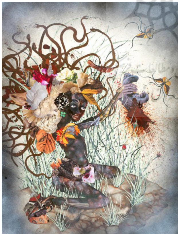
تصویر ۵. وانگچی موتو، عروسی که با سر شتر ازدواج کرده، ۲۰۰۹، ترکیب مواد و کلاژ بر روی مایلار، ۱۰۶۶*۷۶/۲ سانتی‌متر.

این اثر موتو (تصویر ۵) یک پیکره نیمه‌برهنه از زنی سیاه‌پوست را نشان می‌دهد. سر این عروس با مارهای تیره‌رنگ به همراه دسته‌ای از گل‌های متنوع تزئین شده است. به نظر می‌رسد این مجموعهٔ اغراق‌آمیز از تزئینات، کلاه یا تاجی هستند برای عروس تابلو. در زیر پای پیکره علف‌های سبز بلند سوزنی شکل وجود دارد. در پس‌زمینه دو پروانهٔ ترکیبی (هیبریدی) دیده می‌شود؛ پس‌زمینه همچنین دارای فضای مه‌آلودی است که در کناره‌های تابلو رنگ آن به خاکستری تیره می‌گراید. در دستان عروس سر (فک) بریدهٔ شتری دیده می‌شود که از قسمت بریده‌شده خون فواره می‌کند. پیکره دارای دفرماسیون در قسمت صورت (چشم‌ها و لب بزرگ) و در اندام (دست‌های لاغر و کشیده) است. تکنیکی که برای رنگ‌آمیزی اندام به‌کاررفته به‌صورت آبرنگی و در طیف رنگ‌های تیره و کدر است. بر روی بعضی