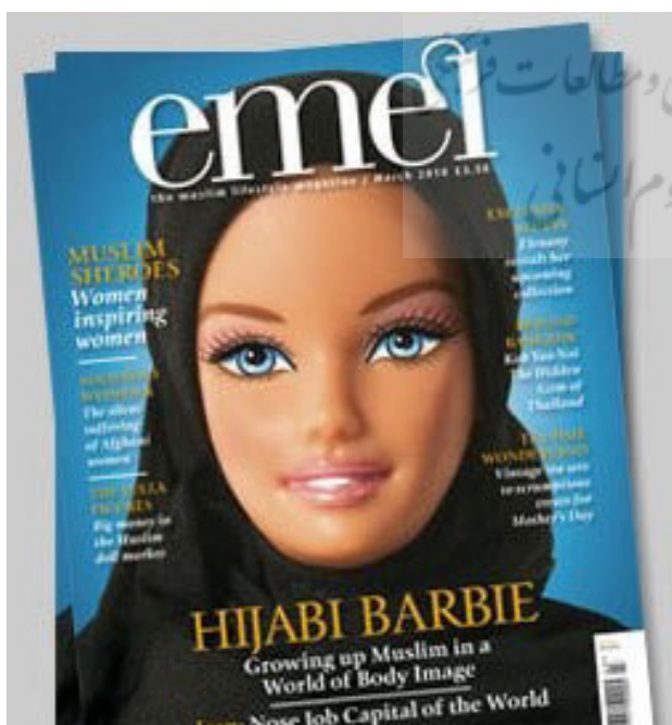
تصویر ۶. ابتهاج محمد. مأخذ: www.instagram.com/ibtihajmuhammad .