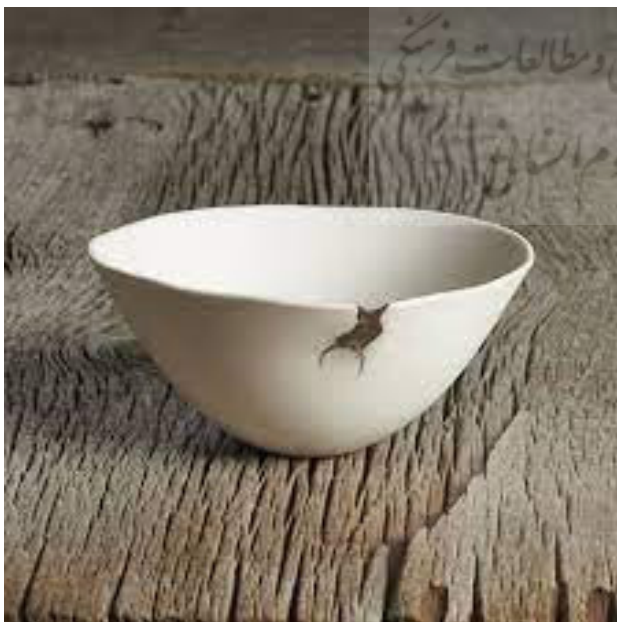
تصویر ۴. پدیده وایی- سابی در مقابل مفهوم «کامل» طراحی غربی، کاسه با طراحی ژاپنی.

در طول قرن بیستم همواره جدال فکری میان هواداران طراحی جهانی و طرفداران هویت‌مندی طراحی برقرار بوده است؛ یک سو طراحی با دستورالعمل‌های جهانشمول و سویی دیگر با ارجاعات فرهنگی و اجتماعی گوناگون. با شروع قرن جدید، متأثر از زمینه‌سازی اولیه پسامدرن و به ویژه در پرتو گسترش روزافزون مطالعات پسااستعماری در طراحی، غور در دستاوردهای تاریخی ملل در طراحی و کاربری ارزش‌های فرهنگی-اجتماعی در آن به حوزه‌ای جذاب در تاریخ‌نگاری طراحی صنعتی تبدیل شده است. برساختن طراحی ملی بر اساس اطلاعات بومی، جایگاهی هم‌تراز تاریخ طراحی جهانی یافته و می‌کوشد فاصله ایجاد شده بین کشورهای اصلی و پیرامونی در تاریخ طراحی را برطرف کند. مطالعات طراحی ملی هم از قابلیت‌های فرهنگی-اجتماعی و هم از پتانسیل رقابت بین‌المللی برخوردار است. این متمایزسازی در طراحی با تأکید بر روش‌های گوناگون ظاهر شده است. بررسی مصادیق عینی، آفرینش طراحی ملی بر اساس جنبه‌های