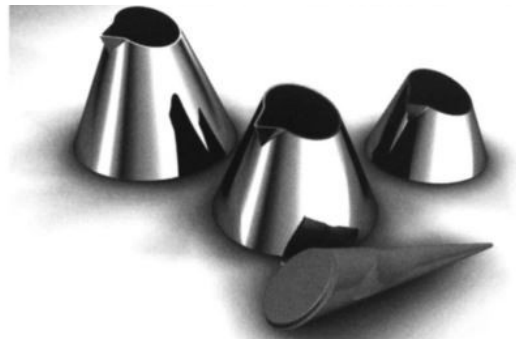
تصویر ۳. طراحی مدرن جزوه مخصوص قهوه ترک، طراح: آیکوت ارول، ۲۰۱۰، م. مأخذ: Balcioglu & Emgin, 2014, 104.

جزیی از طبیعت بوده و قائل به حفظ نظم طبیعی آن. از همین فرهنگ است که مفهوم طراحی وایی- سابی (تصویر ۴) در گزینش مواد خام در ساخت کالا ایجاد شده و به عنوان بخشی از هویت طراحی ژاپنی در سطح جهانی تکثیر می‌شود. مثال دیگر به تلاش جامعه طراحی هلند برمی‌گردد که به تدوین مفهوم «طراحی باز» و برابرنهادن آن با طراحی هلندی، هویتی متکثر و چندصدایی را از سطح تعاملات اجتماعی به طراحی محصول و گرافیک بسط داده و به گونه‌ای عملی به ملی‌گرایی مدنی جامعه عمل پوشانده است. در این اتمسفر، خرده فرهنگ‌ها، گروهک‌های کوچک طراحی و استودیوهای تجربه‌گرا خارج از تسلط کامل طراحی مدرن به فعالیت پرداخته و توانمندی‌های خود را عرضه می‌کنند.