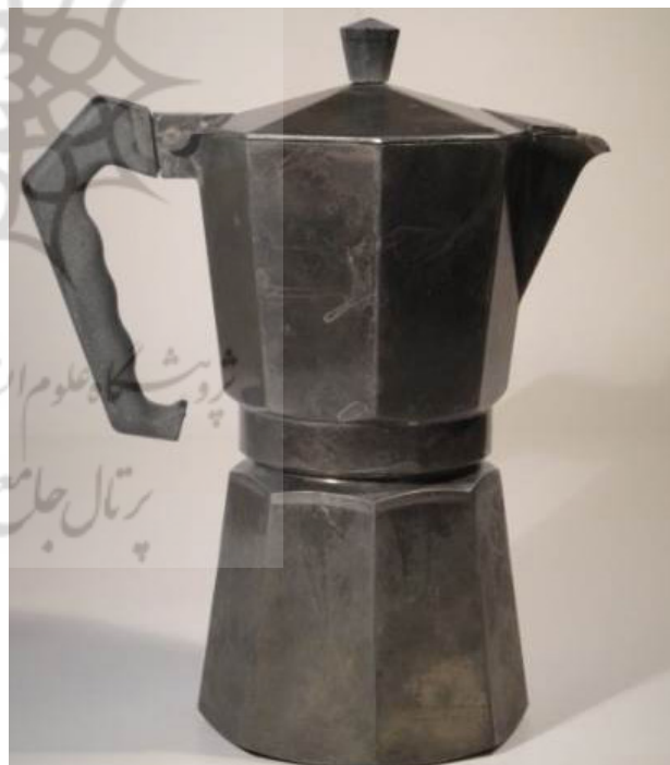
تصویر ۲. دستگاه موکا اکسپرس، طراحی: آلفونسو و رناتو بیالتی - ۱۹۳۳، یادآور هویت ایتالیایی در قالب طراحی ایتالیایی. مأخذ: هاف، ۱۳۸۶، ۱۱۵.

- فرهنگ طراحی متفاوت به مثابه شخصیت ملی در این روش، مورخان طراحی ملی می‌کوشند فرهنگی متفاوت از روش طراحی در قالب گفتمان مدرن اتخاذ تدوین و تبیین کنند. این ابداع با اتکا به ارزش‌های فرهنگی، تجربیات تاریخی و همچنین منطبق بر شناختی خاص از جهان هستی و پدیده‌های آن انجام می‌گیرد. لازم به ذکر است که طراحی صنعتی بر مبنای رفع نیازهای مشتریان و با اتکا بر اصول فنی، زیبایی‌شناسی و علمی توسعه یافته است. طراحی مدرن بر مدار تولید انبوه، راحتی استفاده، فرم ساده و قیمت ارزان استوار است. در دهه ۱۹۹۰ و بر اساس طراحی تجربی این گفتمان با چالش جدی روبرو شد (هاف، ۱۳۸۶، ۲۱). تلقی‌های مختلف از هستی و انسان، نتایج مختلفی در فرهنگ، تفکر و روش طراحی به همراه داشته است. بخشی از افق‌گشایی‌ها در قالب فرهنگ ملی و هویت قومی بروز یافته است. این تکاپوی فکری در طراحی دهه دوم قرن جدید بیشتر شده و در قاره‌های مختلف و با توجه به جهان‌بینی، گفتمان و شرایط اجتماعی- فرهنگی‌شان، دنبال شده است. در اینجا می‌توان به دو نمونه از این‌گونه تمایزسازی اشاره کرد. نمونه ابتدایی را در طراحی نوگرایی ژاپنی بر اساس طبیعت‌گرایی متفاوت از نمونه اروپایی می‌توان دید؛ فرهنگی که در آن، انسان