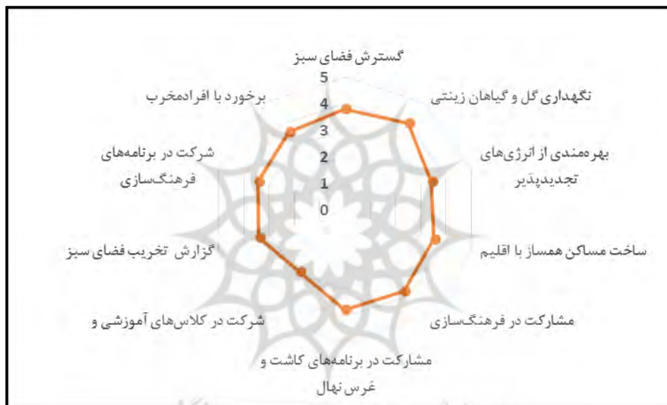
شکل شماره ۴: نمودار میانگین تمایل شهروندان