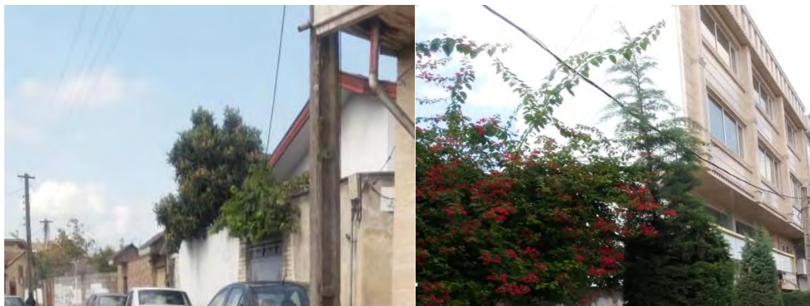
نقشه شماره ۲: معماری سبز شهر رشت