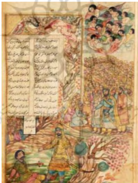
تصویر ۱: نگاره مبارزه علی (ع) با دشمنان، قرن هشتم هجری، نسخه مصور مثنوی مولوی.

در واقع از ویژگی‌های ارتباطات کلامی مثنوی، تأکید مولوی بر پیام حکایت و ارتباطات کلامی است چنانکه در بسیاری موارد خود حکایت را رها نموده نموده و هدف و پیام را به صورت مستقیم برای مخاطب بازگو نموده است. این امر بیانگر نقش ارجاعی کلام و ارتباطات کلام مولوی در مثنوی است. البته دانست که کلام و ارتباطات کلامی در مثنوی دارای نقش ترغیبی و ادبی نیز می‌باشند؛ چنانکه در بسیاری از ارتباطات کلامی مولوی با جملات امری مخاطب را به شنیدن داستان و حکایت دعوت می‌کند و چنانکه گفته شده تمام امکانات زبانی در مثنوی، همه برای رساندن معانی و مفاهیم بلند عرفانی و تعلیمی و پیام‌نهایی آنها به خدمت گرفته شده‌اند. مولوی با دعوت مخاطب خود که دیگران هستند سعی در ایجاد مفاهیم و هدایت آنها دارد و از آنها می‌خواهد به حکایتی که پند و تعلیمی را در بر دارد و حقیقت احوال درونی همه آدمیان است، گوش فرا دهند. در تصویر شماره (۱) نمودی از تصویرسازی تعلیمی مشاهده می‌شود.