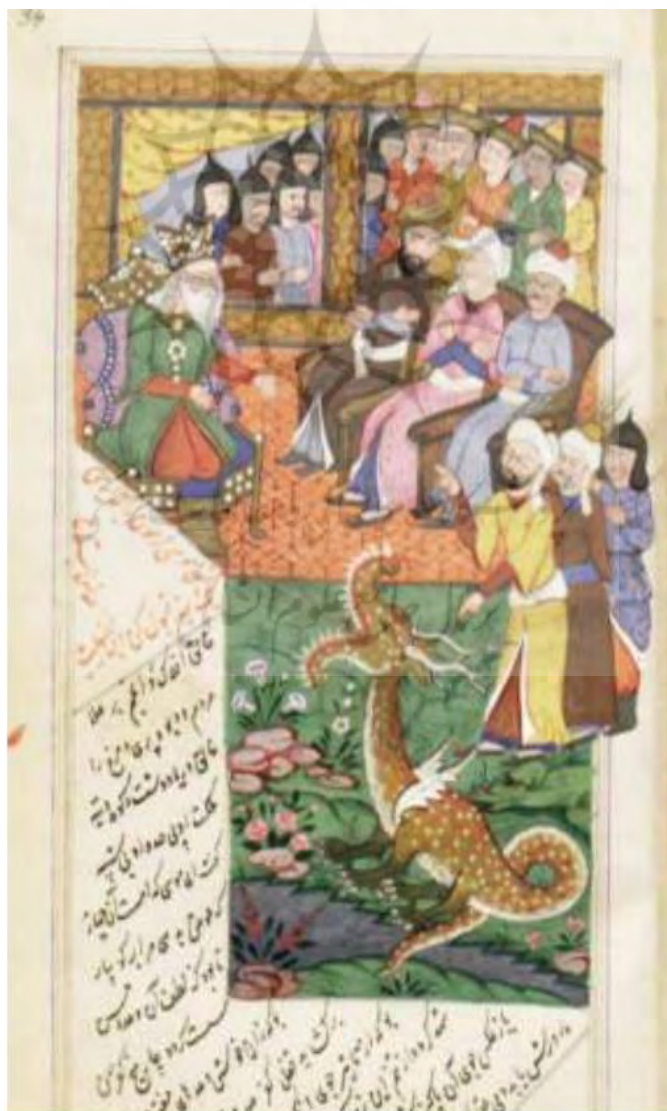
تصویر ۳: نگاره پند دادن موسی به فرعون، مثنوی معنوی مصور از دوره تیموری، قرن هشتم، مأخذ: موزه آستان قدس رضوی.

همه ارتباطات کلامی ایجاد شده فوق در جهت هدایت و امر به معروف و نهی از منکر مخاطب به شیوه حکایت هستند که همان استفاده از کارکرد ارجاعی زبان در ارتباطات کلامی است. در تصویر شماره (۳) پند دادن به عنوان نوعی ارتباط کلامی به تصویر کشیده شده است.