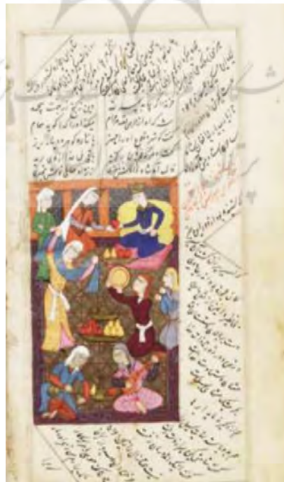
تصویر ۲: برگزاری از مثنوی مولوی، سرور پس از استجابت دعا، نسخ مصور مربوط به دوره تیموری، قرن هشتم.

مولوی با هدف ایجاد مفاهیم و هدایت، دیگران را مخاطب قرار می‌دهد و سعی در شناساندن حقایق وجودی انسان‌ها دارد. راوی در بیت اول این حکایت، خود مولوی است که مفاهیم تعلیمی و عرفانی را به مخاطب القاء می‌کند. بعد فضای حاکم بر حکایت را از طریق گفتگو برای مخاطب به تصویر می‌کشد و از زاویه سوم شخص به بیان این حکایت می‌پردازد. به طوری که گویی مولوی به مخفی‌ترین زاوایای روح شخصیت‌ها آگاه است و نه تنها درباره آنها همه چیز را می‌داند بلکه درباره همه کارها و اشیایی که آنها در خلال حوادث به نوعی با آن درگیر می‌شوند، اطلاع کامل و تجربه وسیع دارد. تصویر شمار (۲) ارتباط میان خالق و مخلوق را به نمایش گذاشته است.