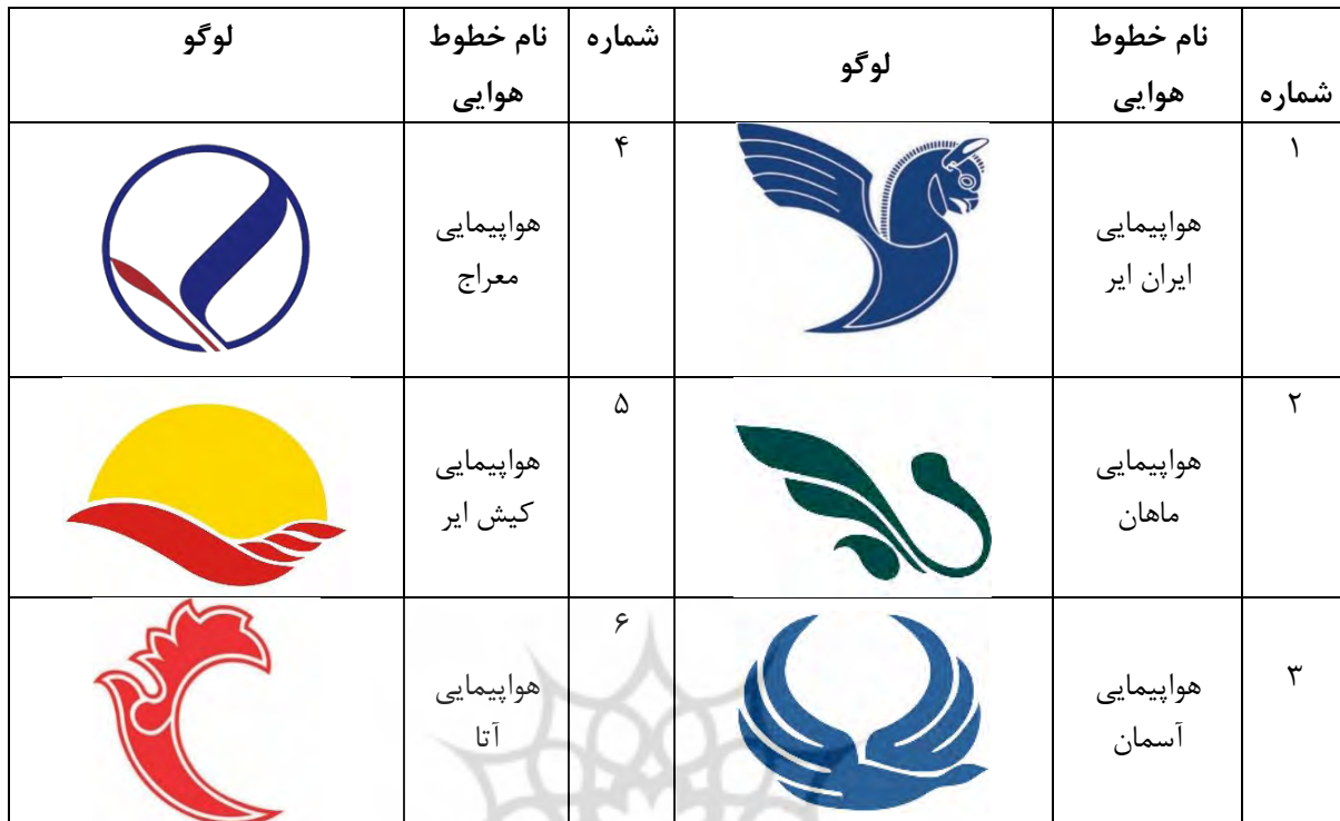
جدول (۱)، خطوط هوایی منتخب و اطلاعات توصیفی لوگوی آنها