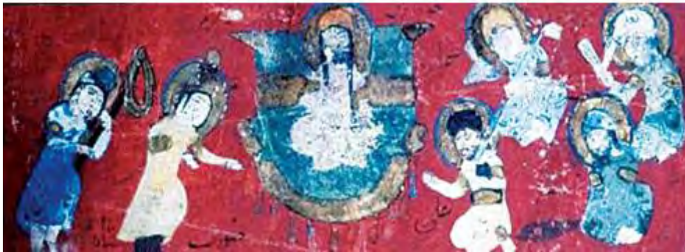
تصویر ۲: پادشاه شام در محضر پیامبر، نسخه ورقه و گلشاه، موزه توقاپای، استانبول، مأخذ: (سعیدی‌زاده و رضی موسوی: ۱۳۹۳)

این ویژگی‌های مقام توکل از منظر امام خمینی (ره) در حالی است که امام محمد غزالی توکل را هر چند امری شایسته می‌داند و انسان متوکل را کسی معرفی می‌کند که در برابر دیگران احساس ذلت نمی‌کند (احیاء علوم الدین، ۱۴۰۶ق، ۴/ ۲۶۰)، اما غزالی، توکل را به معنای دست‌روی‌دست گذاشتن و رهاکردن کار و کوشش می‌پندارد (نراقی، ۱۳۸۳: ۳/ ۲۲۶) که نسبت به این دیدگاه امام خمینی و برخی از عارفان همچون فیض کاشانی در اشکال به این دیدگاه، چنین گفته‌اند: در دین اسلام، توکل با کار و تلاش منافات ندارد. امام غزالی درجات توکل را در موارد ذیل دسته‌بندی می‌کند: درجه اول: آنکه شخص متوکل، به خداوند همانگونه اعتماد کند که به وکیل معتمد خویش اعتماد می‌کند (همان، ۲۰۰-۲۰۱)، درجه دوم آنکه نسبت به خداوند، همانند طفلی باشد نسبت به مادر که جز او را نمی‌شناسد و در مهمات و مشکلات جز به او پناه نمی‌برد و در نهایت درجه سوم آن است که در دست خداوند، بسان مُرده‌ای باشد در دست غسّال که به جبر تسلیم است و همه حرکات و تقلبات خود را از تقدیر ازلی می‌بیند. در این مقام است که دعا و طلب از خداوند متروک و مغفول می‌افتد؛ چراکه شخص متوکل، نه خود را می‌بیند و نه خواست خود را و نه امری خلاف خواست خود را تا دعا کند و خدا را بخواند که به او خیری ببخشد یا از او شری را دفع کند.