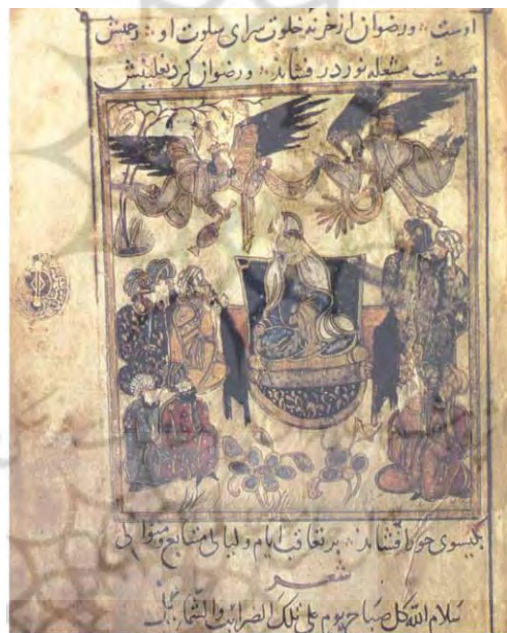
تصویر ۳: پیامبر بر تخت، نسخه مرزبان‌نامه ۶۹۸ ه. ق، مأخذ: (سعیدی‌زاده و رضی موسوی: ۱۳۹۳).

به همین دلیل توانسته‌اند میان مراحل و درجات مختلف رضا تمییز قائل شوند و آن‌ها را برای رهروان طریقت عرفان تبیین سازند. تا اگر کسی مشتاق رسیدن به آخرین مرحله عرفان است، با آگاهی در این مسیر گام بردارد. اما امام محمد غزالی تنها به دو درجه از مقام رضا اکتفا کرده و از درجه سوم یعنی راضی بودن به رضایت خداوند صرف‌نظر کرده است و این امر نشان می‌دهد که ایشان به اندازه امام خمینی (ره) درباره مقام رضا، موشکافانه و با حساسیت به کنکاش پرداخته است. امام خمینی (ره) درباره مقام توکل نیز همانند سایر مقامات عرفانی به ظرافت و دقت بسیار بالایی سخن رانده‌اند و آن را برای دیگران معرفی کرده‌اند. به نظر می‌رسد که بیان ارکان چهارگانه مقوله توکل از سوی امام خمینی (ره) یکی از بهترین مطالبی است که در این زمینه مطرح شده است؛ زیرا تا آدمی نداند که ارکان توکل کردن چیست، محال است که شرایط آن را به خوبی به جای آورد و در رسیدن به مقصودی که به خاطر آن بر خداوند متعال توکل کرده است، کامیاب شود. در صورتی که امام غزالی درباره مقام توکل، به نوعی عقیده دارد که توکل یعنی آدمی دست روی دست بگذارد و بدون هیچ‌گونه تلاشی انتظار داشته باشد که خداوند کار موردنظر وی را به سرانجام برساند. تصویر شماره ۳ با عنوان بر تخت نشستن پیامبر در نوع خود جلوه‌ای از توکل از لحاظ عملی است.