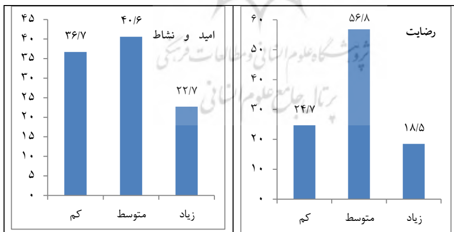
نمودار ۲. توزیع درصدی رضایت اجتماعی، امید و نشاط اجتماعی، ارزیابی وضعیت آینده کشور و امنیت اجتماعی در بین پاسخگویان، ۱۳۹۷

بر اساس نمودار شماره (۲)، از نظر میزان رضایت اجتماعی ۲۵ درصد پاسخگویان رضایت اجتماعی در حد کم داشته‌اند، ۵۷ درصد رضایت اجتماعی در حد متوسط و تنها ۱۸ درصد رضایت اجتماعی زیادی داشته‌اند. حدود ۴۱ درصد پاسخگویان امید اجتماعی و نشاط در حد متوسط داشته‌اند، ۳۷ درصد در حد کم و ۲۳ درصد امید اجتماعی زیادی داشته‌اند. اکثر پاسخگویان (۵۹ درصد) احساس امنیت اجتماعی در حد کم داشته‌اند، ۲۴ درصد در حد متوسط و تنها ۱۷ درصد پاسخگویان احساس امنیت اجتماعی در حد زیاد داشته‌اند. حدود ۷۴ از پاسخگویان این تصور را دارند که وضعیت بدتر می‌شود؛ ۱۴ درصد عدم تغییر وضعیت و ۱۳ درصد بهتر شدن وضعیت آینده کشور را متصور بوده‌اند.