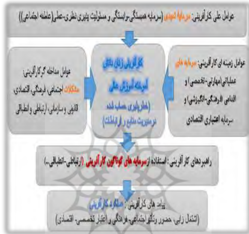
شکل ۱. مدل پارادایمی عوامل اجتماعی مؤثر بر کارآفرینی حاصل از نظریه داده بنیاد