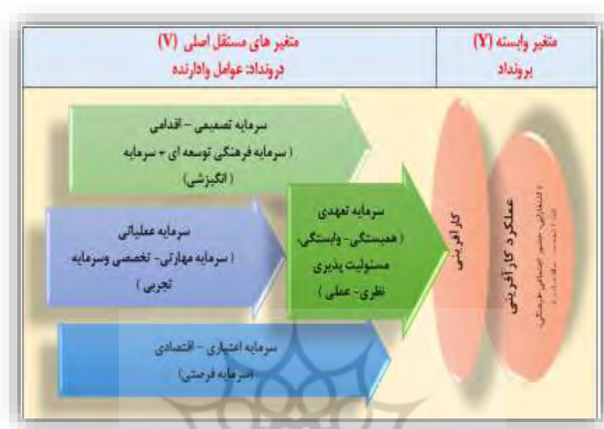
شکل ۲. مدل علی برگرفته از مدل پارادایمی حاصل از نظریه داده بنیاد