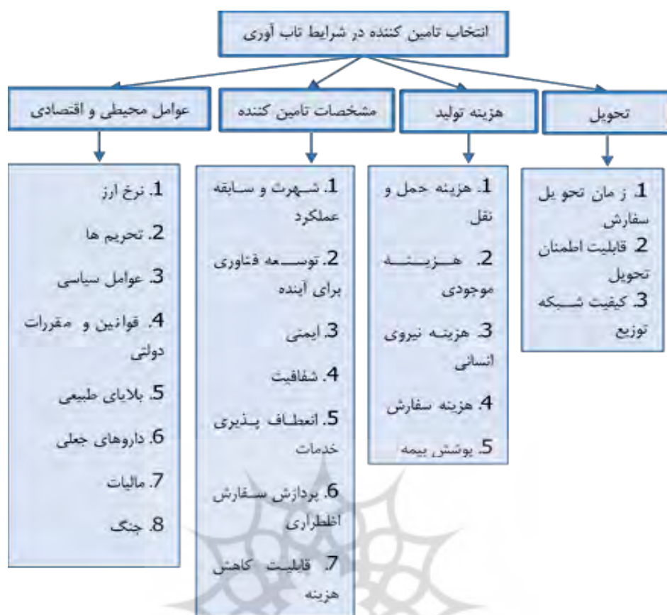
شکل شماره (۱): شبکه شاخص ها و مولفه های شناسایی شده با استفاده از تکنیک دلفی فازی