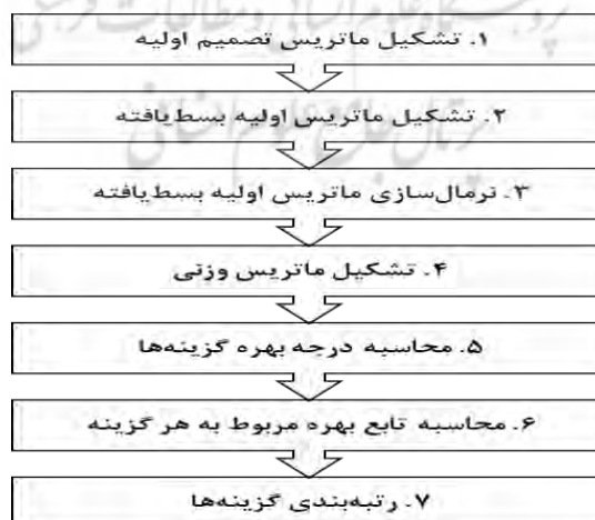
شکل شماره (۲) الگوریتم روش مارکوس

روش مارکوس بر مبنای تعریف رابطه‌ی بین گزینه‌ها و مقادیر مرجع (گزینه ایده‌آل و غیرایده‌آل) می‌باشد و توسط استویج و همکاران در سال ۲۰۱۹ ارائه شده است. بر اساس روابط تعریف شده تابع بهره مربوط به هر گزینه محاسبه شده و رتبه‌بندی توافقی بر اساس رابطه هر گزینه با گزینه ایده‌آل و غیرایده‌آل انجام می‌شود. اولویت‌های تصمیم‌گیری براساس تابع بهره تعریف می‌شوند. تابع بهره، نشان‌دهنده موقعیت هر گزینه را در مقایسه با گزینه ایده‌آل و غیرایده‌آل است. مقدار تابع بهره برای بهترین گزینه یک است که در واقع نشان‌دهنده گزینه ایده‌آل است و بیشترین فاصله را با گزینه غیرایده‌آل دارد. الگوریتم روش مارکوس در شکل ۲ آورده شده است.