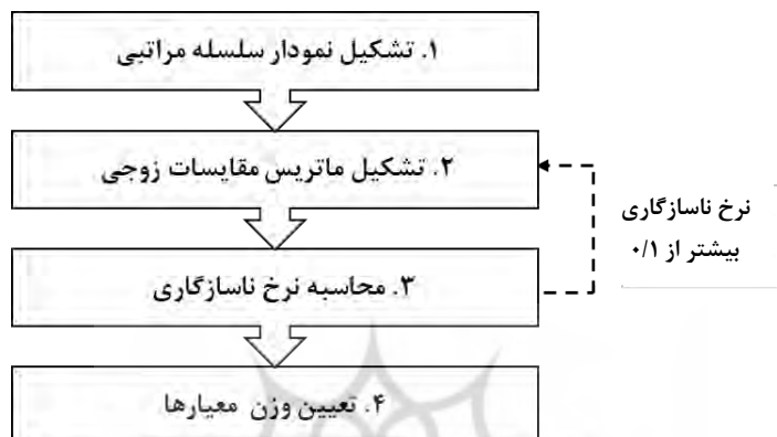
شکل شماره (۱): الگوریتم روش AHP

واژه AHP مخفف عبارت Analytical Hierarchy process به معنی فرایند تحلیل سلسله مراتبی است این روش در سال ۱۹۸۰ توسط آقای ساعتی برای حل مسائل تصمیم‌گیری چند معیاره ارائه شده است. در اولین قدم از این روش باید معیارهای موثر و مورد نظر شناسایی شوند. سپس گزینه‌های مساله تصمیم‌گیری براساس معیارهای شناسایی شده، ارزیابی می‌شوند. روش AHP یکی از روش‌های پرکاربرد برای رتبه‌بندی و تعیین اهمیت عوامل است که هر دو ارزیابی عینی و ذهنی را در قالبی یکپارچه با مقایسات زوجی ترکیب کرده و مساله را به‌شکلی سلسله مراتبی سازماندهی می‌کند. در شکل ۱ الگوریتم روش AHP آورده شده است.