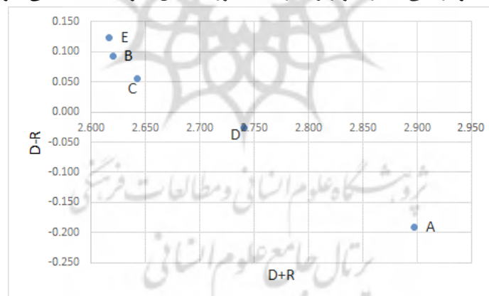
شکل شماره (۳): نمودار علی معیارهای اصلی

با توجه به جداول شماره ۴ و ۵ نمودار علی معیارها و زیر معیارها به صورت شکل ۳ و ۴ ملاحظه می شوند.