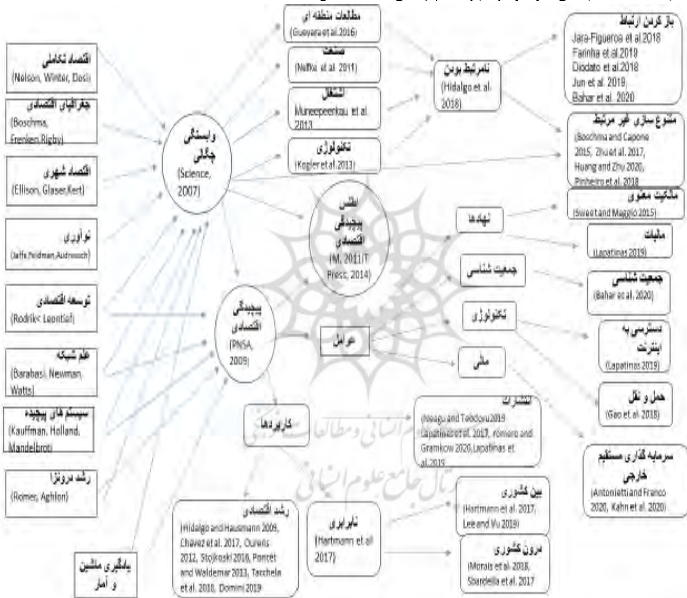
شکل شماره (۱): خلاصه‌ای از ادبیات و کاربردهای پیچیدگی اقتصادی (Hidalgo, 2021).

درآمد و بیکاری را توضیح می‌دهد. معیارهای پیچیدگی اقتصادی ماتریس‌های تخصصی هستند که جغرافیای صدها فعالیت اقتصادی را توضیح می‌دهند. معیارهای پیچیدگی اقتصادی توضیح و پیش‌بینی تغییرات بین‌المللی و منطقه‌ای در درآمد، رشد اقتصادی، نابرابری درآمدی، نابرابری جنسیتی و انتشار گازهای گلخانه‌ای را پیش‌بینی و توجیه می‌کنند. روش‌های پیچیدگی اقتصادی با مطالعات در مقیاس‌های جغرافیایی چندگانه (از کشورها به شهرها) و انواع فعالیت‌های اقتصادی (محصولات، صنایع، مشاغل، ثبت اختراع و مقالات تحقیق) چشم انداز مناسبی را در اختیار سیاست‌گذاران قرار داده است (Hidalgo, 2021). در شکل شماره ۱ خلاصه‌ای از مبانی نظری و نیز کاربردهای پیچیدگی اقتصادی نشان داده شده است.