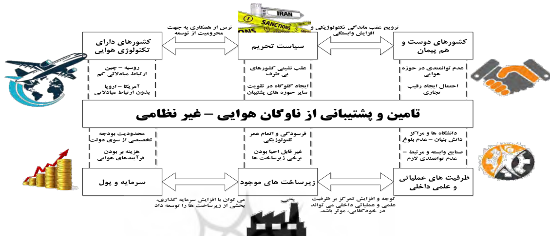
شکل شماره (۱): تصویر غنی از مسئله تامین و پشتیبانی از ناوگان هوایی

همانطور که پیش از این نیز اشاره گردید، (SSM) دارای ۷ گام اجرایی است که می توان آنها را در ۴ مرحله خلاصه نمود. در مرحله اول می بایست مسئله از ابعاد مختلف بررسی گردد و تصویر کلی از وضعیت آن و پیچیدگی های موجود، حاصل شود. این تصویر را اصطلاحاً تصویر غنی می نامند.