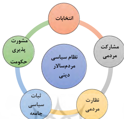
شکل ۱ شاخص‌های نظام سیاسی مردم‌سالار دینی

مردم جامعه؛ از شاخص‌های یک نظام سیاسی مردم‌سالاری است که با رویکرد دینی حکمفرمایی می‌کند. در شیوه حکمرانی مردم‌سالار دینی، حکومت با مشارکت دادن مردم، مشورت‌پذیری، حق انتخاب دادن به مردم، نظارت مردمی و ثبات سیاسی در جامعه رضایت‌جمهور و هدایت و سعادت آنها در دنیا و آخرت رقم خواهد زد.