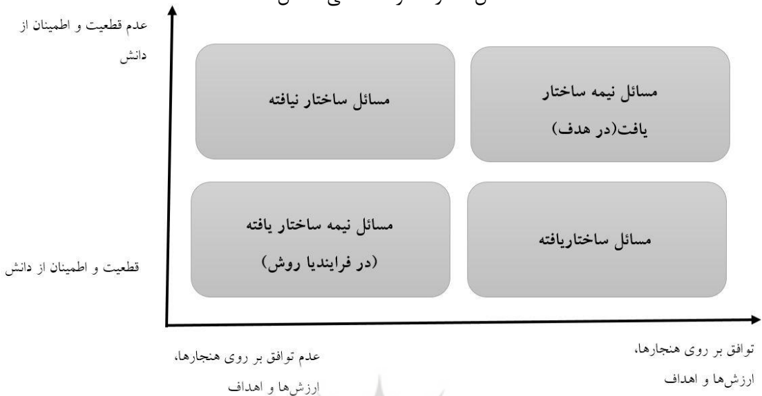
شکل شماره ۱: گونه شناسی مسائل