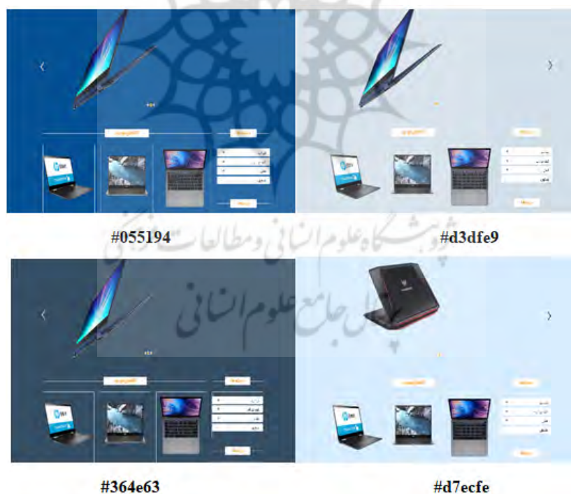
شکل ۳. تصاویر وبسایت‌های با کد آبی

گروه آزمایش از طریق اختصاص کد به آدرس لینک وبسایت و قرعه‌کشی دستی در چهار گروه مساوی در معرض رنگ آبی و رنگ سبز قرار گرفتند. گروه کنترل در معرض نوع رنگ خنثی (سفید)، اشباع رنگ خنثی و درخشندگی رنگ خنثی قرار گرفتند. گروه آزمایش و کنترل از طریق شبکه‌های اجتماعی که در گروه‌های عضویت محققان بودند، برای