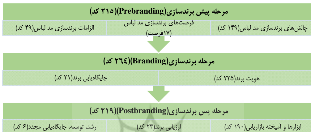
شکل ۱. مراحل کلی برندسازی و زیرمجموعه‌های هر مرحله در صنعت مد لباس

در نهایت پس از بررسی نظرات خبرگان و تحلیل آنها مدلی جهت برندسازی از نظرات و مصاحبه‌های آنها استخراج گردید و برای آنها ارسال گردید و از آنها خواسته شد تا نظرات خود را در مورد مدل نهایی بیان کنند. بعد از تغییرات جزئی دو مدل نهایی زیر استخراج گردید. در مدل اول محقق ۸ مرحله برندسازی گفته شده توسط کارشناسان و خبرگان را در سه مرحله کلی پیش‌برندسازی، برندسازی و پس‌برندسازی قرار داده که در زیر مشاهده می‌نمایید.