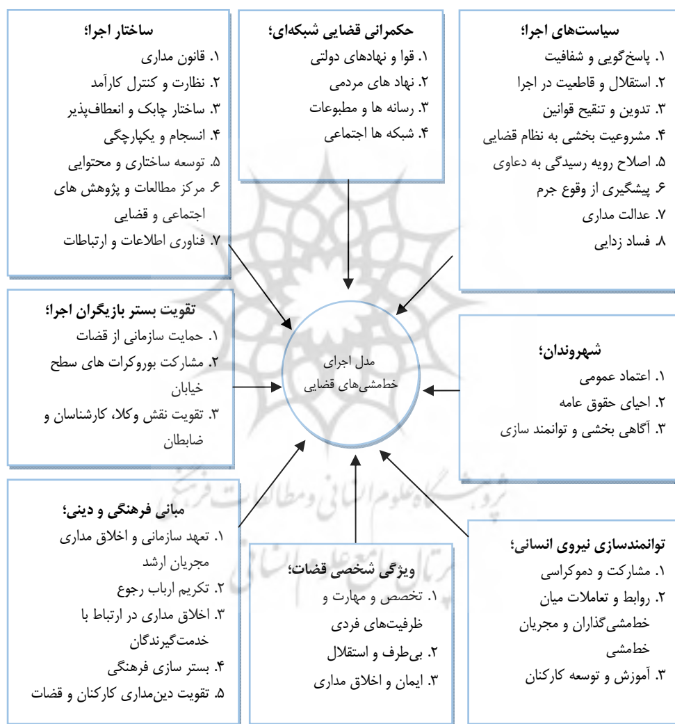
شکل ۱. مدل مفهومی پژوهش

در این پژوهش پس از شناسایی مضامین نهایی از طریق مصاحبه با خبرگان و احصا مضامین به روش تحلیل مضمون و اعتباریابی طی سی راند رویکرد دلفی فازی مدل نهایی در قالب شکل ۱ طراحی و ترسیم گردید. مضامین فراگیر (ابعاد) حاصل از یافته‌های پژوهش به ترتیب اولویت عبارت‌اند از: ۱. سیاست‌های اجرا؛ ۲. تقویت بستر بازیگران اجرا؛ ۳. حکمرانی شبکه‌ای قضایی؛ ۴. ساختار اجرا؛ ۵. توانمندسازی نیروی انسانی؛ ۶. ویژگی شخصی قضات؛ ۷. مبانی فرهنگی و دینی؛ ۸. شهروندان.