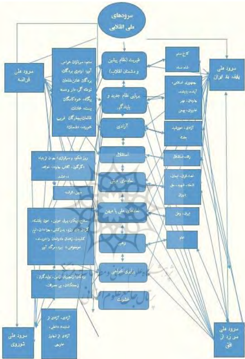
شکل ۱. شبکه مضامین سرودهای ملی انقلابی ایران، فرانسه و روسیه