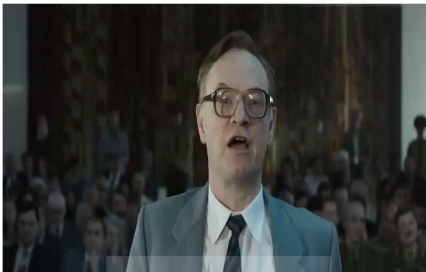
تصویر ۲. صحنه استشهد