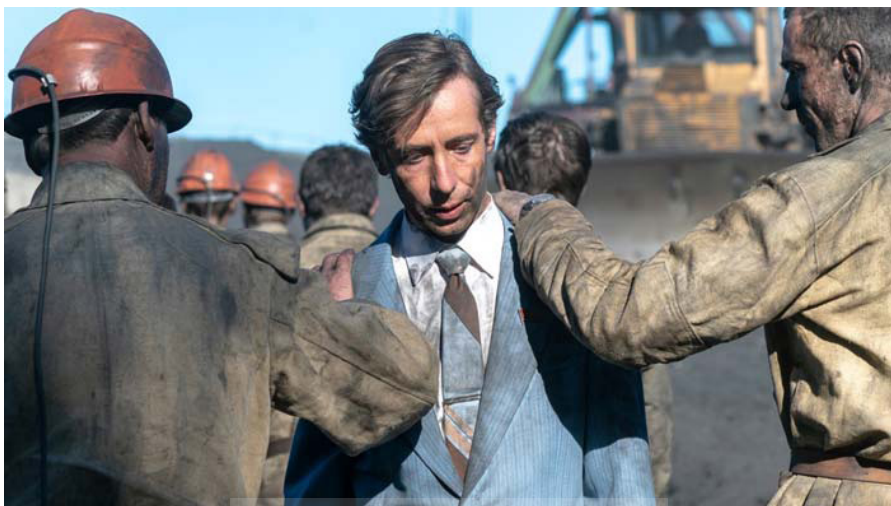
تصویرا. شجاعت کارگران.

صحنه اظهارات لگاسوف (شخصیت و قهرمان فیلم) در دادگاه: