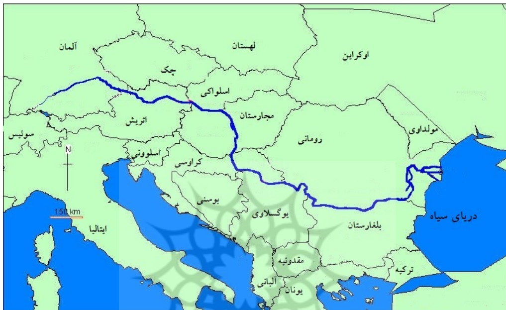
شکل (۲). موقعیت رودخانه دانوب در قاره اروپا.

است (ووکویچ، ۲۰۱۴: ۳۲۵). از سویی بهبود وضعیت کانال کشتیرانی دانوب که امروزه به وسیله کانال به «ماین» و از آنجا به «راین» می‌پیوندد به این رود اجازه می‌دهد که به شاهره کشتیرانی مهمی تبدیل شود که دریای شمال را به دریای سیاه متصل می‌کند (محمدعلی پور، ۱۳۹۴: ۱). شکل (۲).