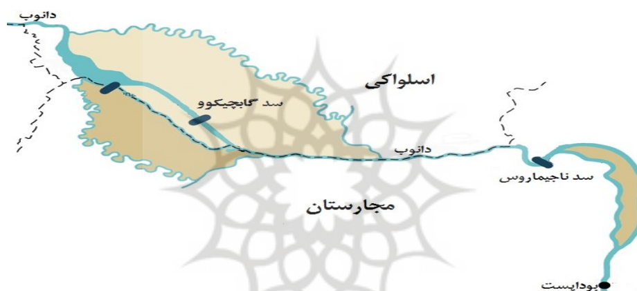
شکل (۳). موقعیت سد‌های گابچیکوو-ناگیماروس بر روی رودخانه دانوب

اسلواک‌ها مسیر دانوب را از طریق یک کانال به نیروگاه "گابچیکوو" منحرف کردند. اقدامی که موجب شد بستر اصلی دانوب در خاک مجارستان یک‌باره ۹۰ تا ۹۵ درصد از آب خود را از دست بدهد. به‌طوری که تیرک‌های شاخص سطح آب، در خشکی قرار گرفت و سطح سفره‌های آب زیرزمینی دو-سه متر افت کرد (مولدوا، ۱۳۸۴: ۲۶). مجارهای تندروها از انفجار سد سخن راندند که به احتمال قوی باعث جنگ می‌شد که در این میان اتحادیه اروپا پیشنهاد میانجی‌گری داد. بر پایه برآوردها منفعت اتحادیه اروپا برای مداخله در این قضیه در ثبات منطقه نهفته بود. اتحادیه اروپا که نگران تکرار وقایع بالکان در این منطقه بود و بیم این می‌رفت که با آغاز درگیری افزون بر دخالت قدرت‌های فرامنطقه‌ای، ناامنی به کل منطقه بگسترده، پیشنهاد میانجی‌گری داد. با این حال، ایده میانجی‌گری در آغاز توسط طرف مجارستانی پشتیبانی نشد. چرا که مجارستان مسئله میانجی‌گری را منوط به رد «نسخه c» طرف اسلواکی می‌کرد (ووکویچ، ۲۰۱۴: ۳۳۶). شکل (۳).