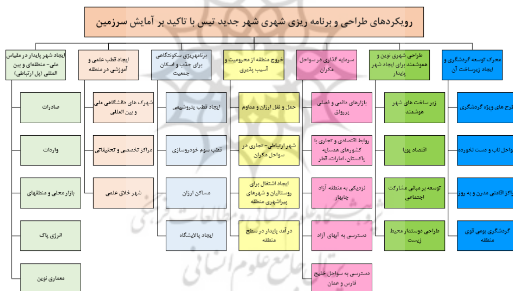
شکل (۱). مدل مفهومی تحقیق، (منبع: نگارندگان، ۱۳۹۸)

شده و اهداف معین. معمولاً برای تمرکززدایی کالبدی، اقتصادی و اجتماعی طراحی می‌شود تا با وجود جاذبه نزدیکی به شهرهای بزرگ، جمعیت تشویق به خروج از مادر شهر شود. بنابراین شهر جدید دارای تاریخ تولد مشخص است و در زمان کوتاه معینی ساخته می‌شود. شهر جدید با حومه، اختلاف اساسی دارد؛ حومه یک ناحیه مجزای مسکونی است که ساکنان آن برای کار به شهر دورتر رفت و آمد می‌کنند اما شهر جدید باید همه عملکردهای شهری را به اندازه معین داشته باشد. از زمان احداث سکونت گاه‌های شهرهای جدید که در آستانه قرن حاضر با طرح اندیشه هاوارد و نیز ایجاد باغ شهرهای ولوین و لچ ورث شروع شد، تاکنون در اهداف این مراکز سکونتی تحولات بسیاری به وجود آمده است (زیاری، ۱۳۸۷). در زمینه برنامه‌ریزی و آمایش منطقه‌ای با تاکید بر شهرهای جدید، رویکردها و برنامه‌های مختلفی وجود دارد. با این حال و به صورت کلی رویکردهای برنامه‌ریزی و طراحی شهر جدید در راستایی توسعه منطقه‌ای و بر اساس نظر مدروس ۱ (۲۰۱۴) ایجاد شهر پایدار، ایجاد قطب علمی و آموزشی، جذب و اسکان جمعیت، محرومیت زدایی، سرمایه گذاری و طراحی شهر پایدار با رویکرد هوشمند مهم‌ترین برنامه‌های در این خصوص می‌باشند. بر همین اساس و با توجه به مطالعات صورت گرفته و چارچوب این مطالعه بر اساس شاخص‌ها و متغیرهای توضیحی مدل مفهومی تحقیق ترسیم و ارائه شد. شکل (۱).