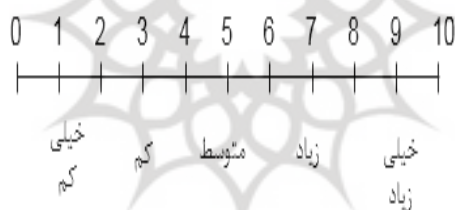
شکل (۴). مقیاس دوقطبی فاصله‌ای

پس از روشن شدن میزان اهمیت معیارها و شاخص‌ها، می‌باید امتیاز آن‌ها مشخص شود. برای تعیین امتیاز، از اطلاعات مربوط به جداول مقایسه وضع موجود منطقه (حین اجرا طرح) و طرح موردنظر استفاده شد. این اطلاعات حاصل تجزیه و تحلیل وضع موجود در منطقه و طرح CDS است که پیش‌ازین بدان اشاره شد. به این صورت که پس از دریافت نظرات در قالب مصاحبه آزاد، امتیازدهی به معیارها انجام شد. برای اندازه‌گیری امتیاز اثرات مثبت و عوامل منفی بر هر شاخص و در نهایت معیار، از مقیاس دوقطبی فاصله‌ای استفاده شد. این اندازه‌گیری بر اساس یک مقیاس ۱۰ نقطه‌ای است که در آن صفر مشخص‌کننده حداقل ارزش ممکن و ۱۰ مشخص‌کننده حداکثر ارزش ممکن از اثرات عوامل مثبت بر معیارهای موردنظر است. در این مقیاس، نقطه وسط (۵) نقطه شکست مقیاس بین مطلوب و نامطلوب است، ضمناً از مقادیر ۲، ۴، ۶، و ۸ می‌توان در هنگامی استفاده کرد که حالت‌های میانه وجود دارد (زبردست و همکاران، ۱۳۹۲).