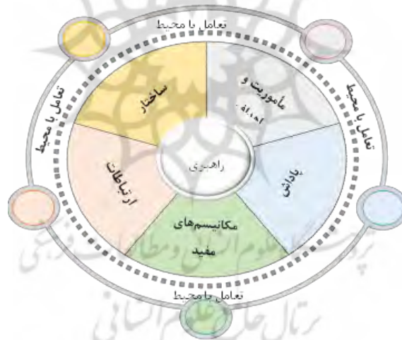
شکل ۱. چارچوب مفهومی پژوهش (مدل هفت بعدی وایزبورد، ۱۹۷۶: ۴۳۲)

آسیب‌شناسی سازمان‌ها ارائه کردند، این است که با استفاده از این مدل می‌توان سازمان را از جهات و زوایای مختلف، بررسی و ارزیابی کرد؛ هم‌چنین این مدل، مدلی نسبتاً ساده و قابل فهم در مقایسه با سایر مدل‌ها بوده که عملکرد جنبه‌های مختلف و متغیرهای کلیدی سازمان را تجزیه و تحلیل می‌کند (لوک و کراوفورد، ۲۰۰۵: ۱۱۱؛ وایزبورد: ۱۹۷۶: ۴۴۰). در توجه به مزایای ذکر شده درخصوص مدل وایزبورد، در آسیب‌شناسی آموزش مهارتی (طرح جامع مهارت‌آموزی) کارکنان وظیفه نیز از همین مدل استفاده شده است. هفت بعد اصلی مدل مذکور شامل اهداف ۱ ، ساختار ۲ ، ارتباطات ۳ ، پاداش ۴ ، راهبری ۵ ، به‌کارگیری مکانیسم‌های مفید ۶ و نگرش به‌سوی تغییر ۷ هستند. در راستای هدف و متناسب با چارچوب مفهومی در این پژوهش به سؤال زیر پاسخ داده خواهد شد: آسیب‌ها و نقاط قابل بهبود ابعاد اهداف، ساختار، پاداش (مشوق)، ارتباطات، راهبری، مکانیسم‌های مفید و نگرش به‌سوی تغییر (محیط) آموزش مهارتی (طرح جامع مهارت‌آموزی) کارکنان وظیفه نیروهای مسلح کدام‌اند و هر یک از آسیب‌ها چه رتبه‌ای دارند؟