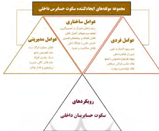
شکل (۲). چارچوب محتوایی پژوهش

در دوم تحلیل دلفی تأیید شدند که نشان دهنده‌ی نقطه کفایت نظری شاخص‌های سکوت حسابرس داخلی می‌باشد. براساس مولفه‌ها و شاخص‌های تعیین شده، مدل مفهومی سکوت حسابرس داخلی به ترتیب زیر ارائه می‌شود: