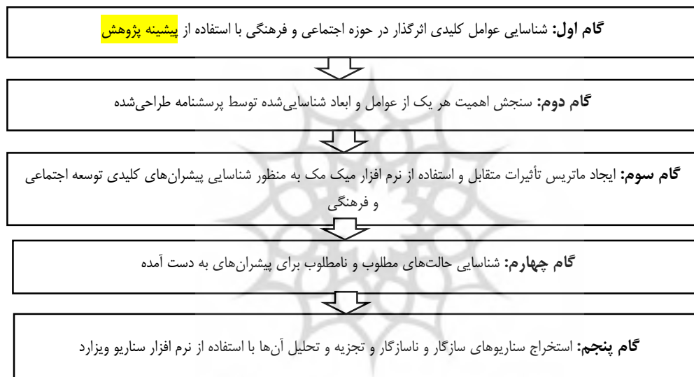
شکل ۱. مراحل اجرای پژوهش

روش شناسی پژوهش به کاربرده شده از نظر هدف، از نوع اکتشافی، تبیینی و توصیفی است. مراحل انجام این پژوهش به صورت شکل ۱ نشان داده شده است.