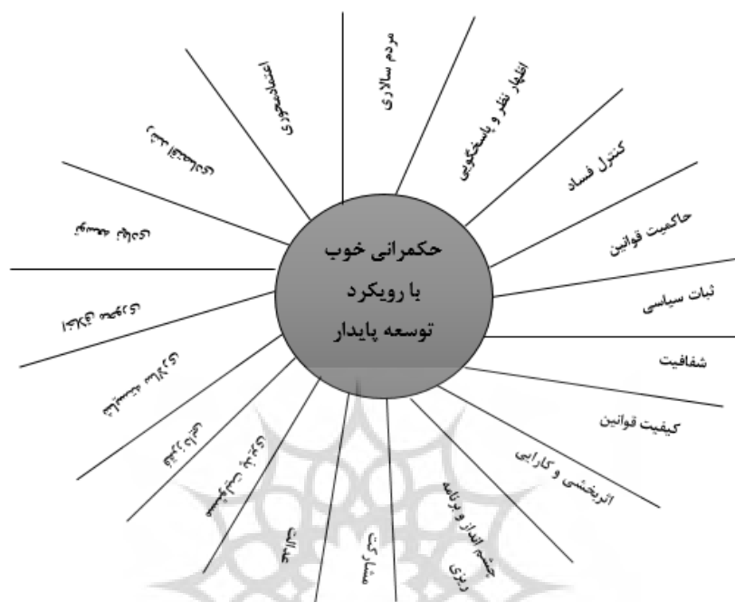
شکل شماره ۲: الگوی مفهومی تحقیق