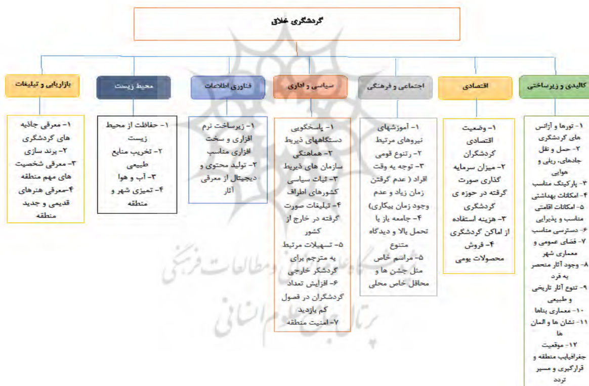
شکل (۱): شاخص های گردشگری خلاق

یکی از اشکال گردشگری که در دهه‌های ۱۹۸۰ تا ۱۹۹۰ مطرح شده است، گردشگری خلاق است که به طور مؤثری جامعه را در جهت نیل به توسعه، پیش می‌برد. به نظر می‌رسد که خلاقیت به اکسیری برای طیف گسترده‌ای از مشکلات، تبدیل شده است. توسعه شهرهای خلاق، صنایع خلاق و... می‌تواند در خدمت جذب طبقه خلاق (Florida, 2002) باشد و به طور امیدوار کننده‌ای، اقتصاد را نجات داده، جوامع را به هم پیوند دهد و فرهنگ محلی را احیا کند. به هر حال، یک رویکرد در بسیاری از مطالعات اخیر درباره خلاقیت، در حال ظهور است که در حوزه گردشگری نیز وجود دارد. رشد سریع انتقاد بنیادی استراتژی‌های توسعه اخلاق، توسعه گردشگری فرهنگی را انعکاس داده است. در حقیقت، گردشگری خلاق، اغلب به عنوان یک شکل گسترده از گردشگری فرهنگی دیده می‌شود. عوامل متعددی بر گردشگری خلاق موثر می‌باشند که در شکل (۱) نشان داده شده است.