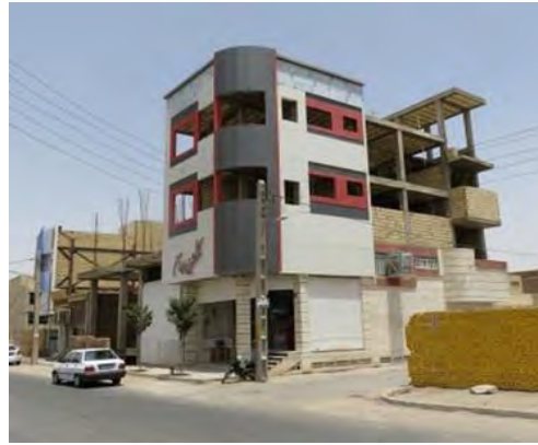
شکل (۳): نمای کامپوزیت و تمام سنگ در بافت جدید