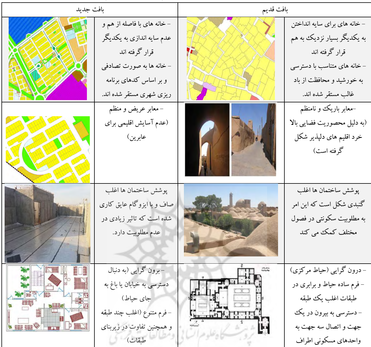
جدول (۲): مقایسه مولفه‌های معماری همساز با اقلیم در بافت جدید و قدیم شهر یزد