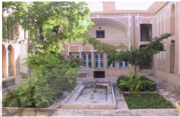
شکل (۴): حیاط مرکزی در خانه های بافت قدیمی