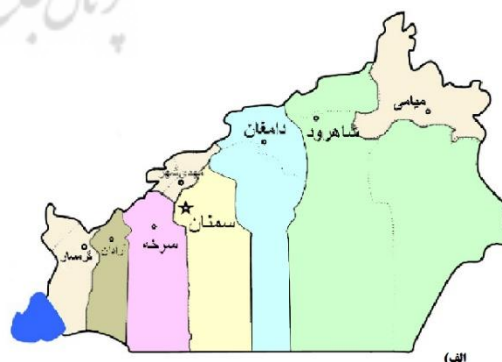
شکل ۲. الف) نقشه استان سمنان و شهر دامغان ب) محل منطقه ویژه اقتصادی دامغان