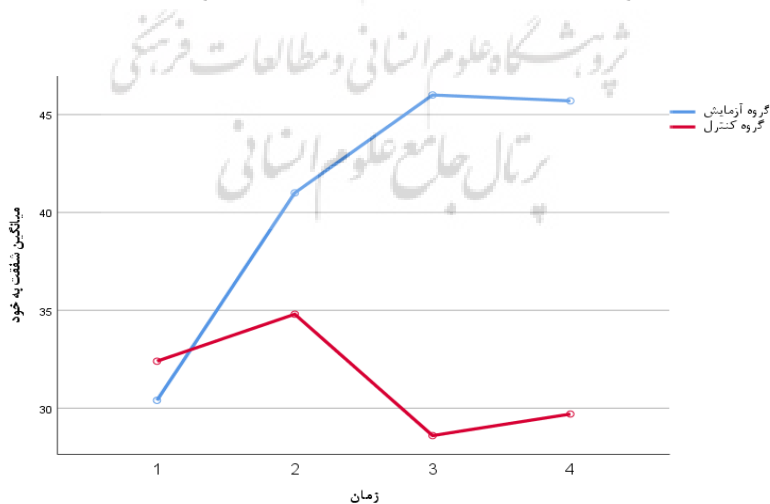
نمودار ۳ اثر تعاملی زمان و گروه بر میانگین شفقت به خود