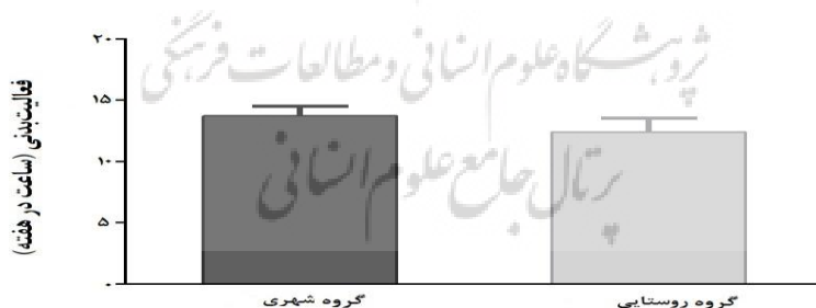
نمودار ۲ میزان فعالیت بدنی دانش‌آموزان منطقه شهری و روستایی

همچنین نتایج جدول ۱ نشان داد میانگین سهم مصرف گروه‌های غذایی سالم مانند، گوشت، لبنیات، میوه و سبزی‌ها ( p=0/000 ) و نان و غلات ( p=0/001 ) دانش‌آموزان منطقه شهری نسبت به دانش‌آموزان ساکن در مناطق روستایی به طور معناداری بیشتر بود. بعلاوه میزان